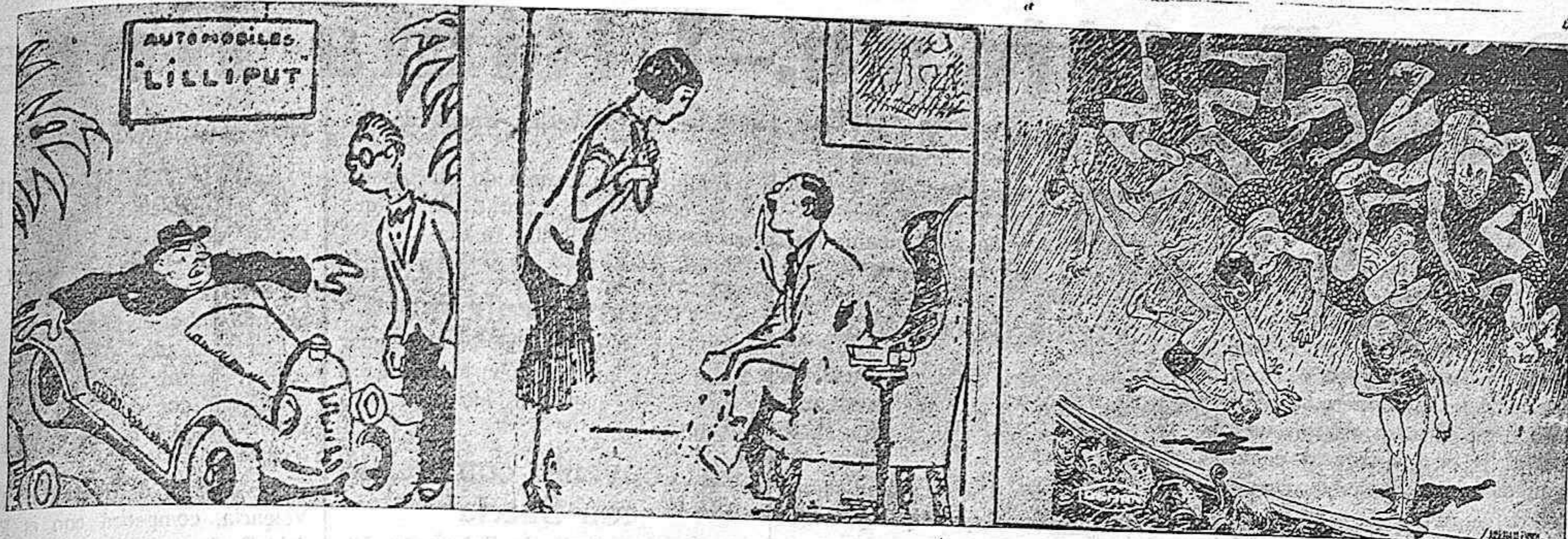
—¿Le gusta este coche? —No, deme un número mayor... me molesta un poco en los sobacos.