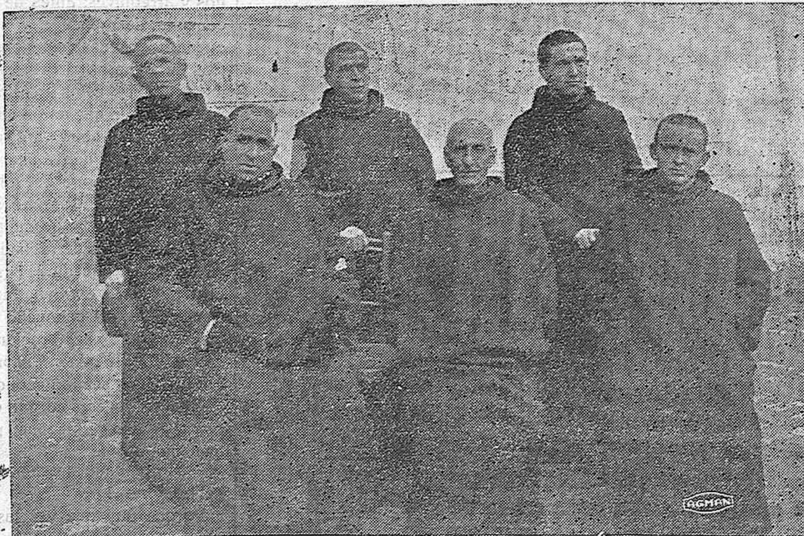
Del Manicomio.—Algunos de los religiosos de San Juan de Dios que dirigen e. te benemérito establecimiento.