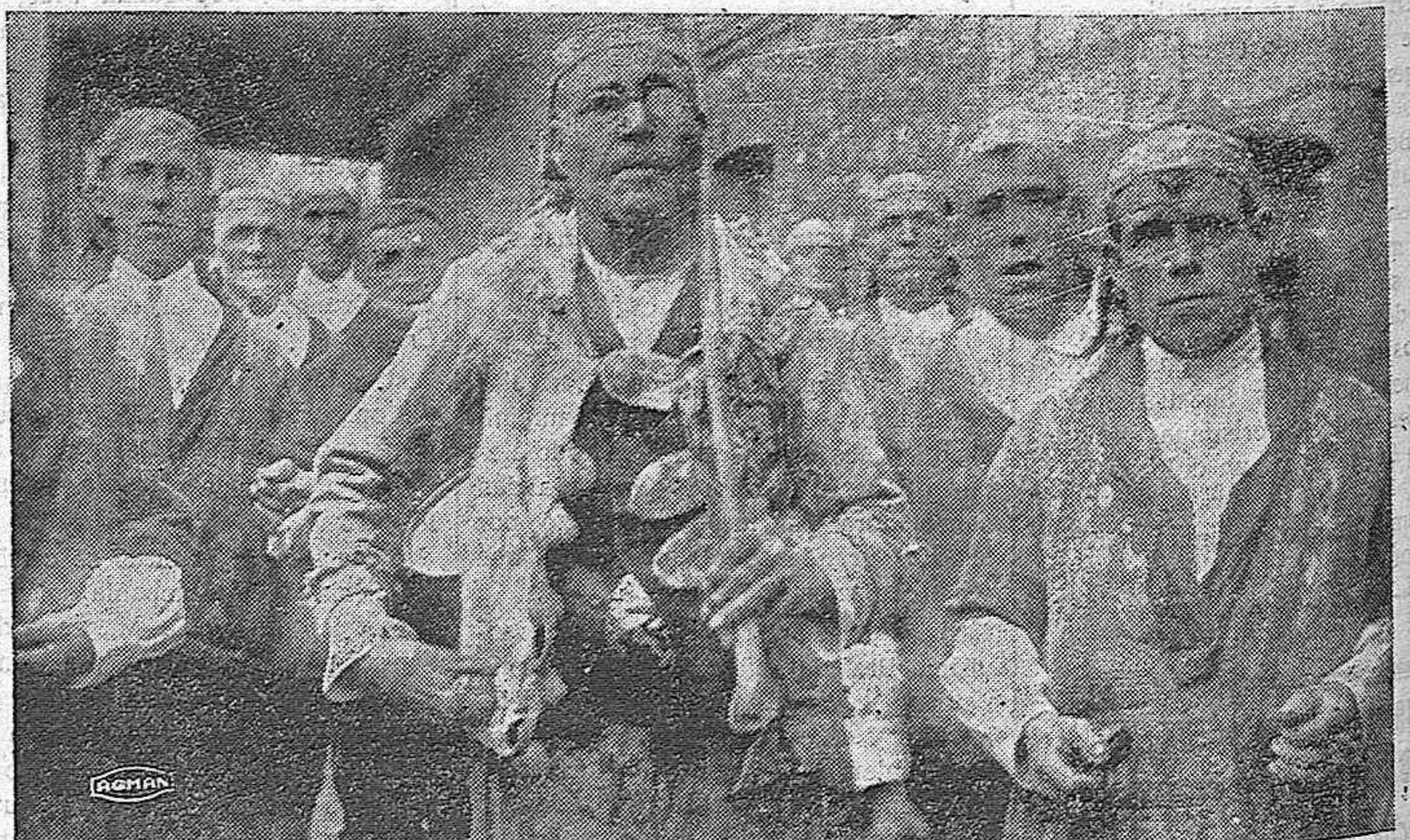
Villamediana.—Los danzantes que actuaron en la fiesta del domingo