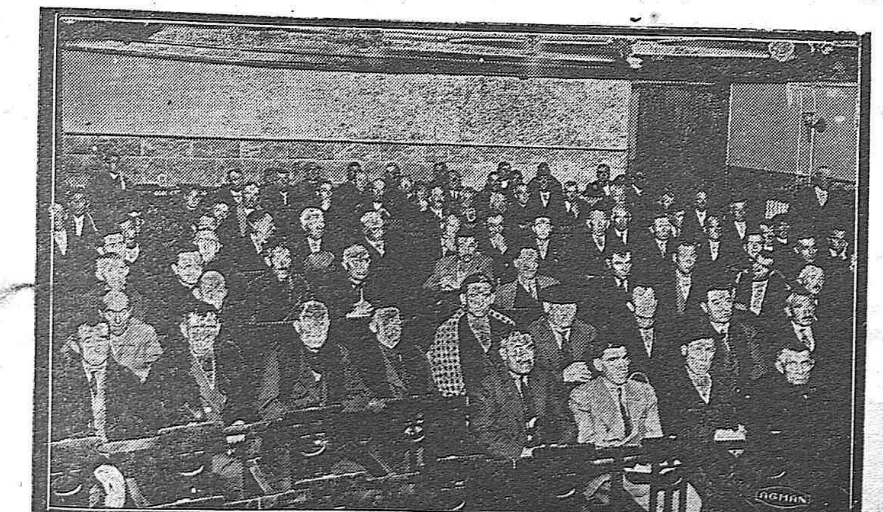
Los representantes de los Sindicatos de la provincia, reunidos en el Cinema España.