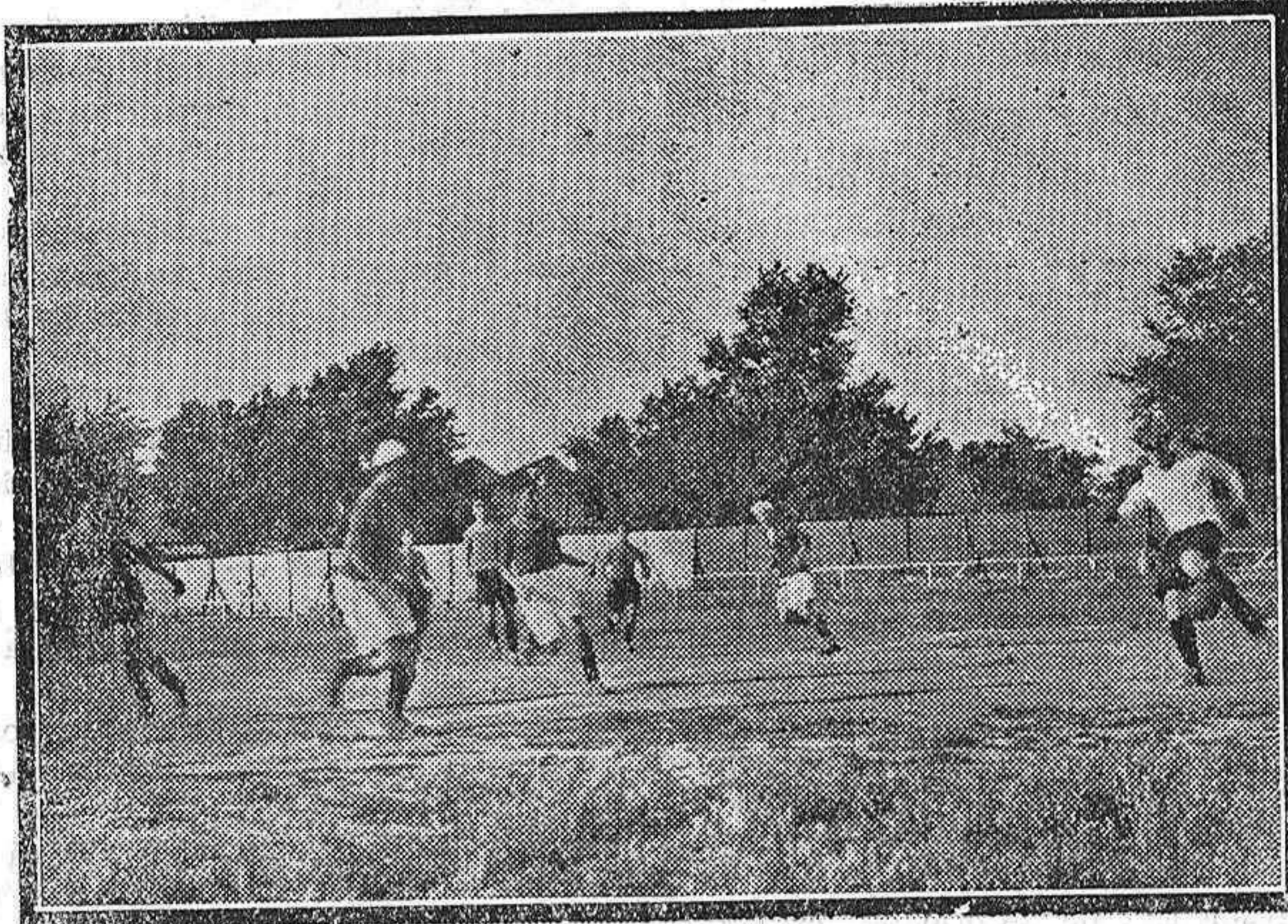
DEL PARTIDO DE AYER.—Un formidable «chut» de nuestros delanteros, es difícilmente parado por el guardameta de la Selección Vallisoletana

mo, malogrando una gran jugada. Fué una lástima.