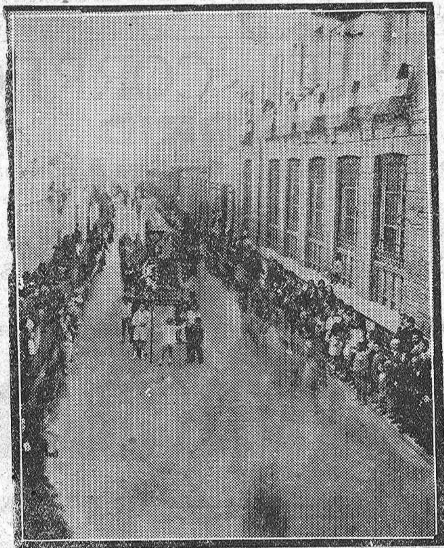
LA PROCESION DE AYER.—En la calle de Menéndez Pelayo

En el ministerio de Estado se ha facilitado una nota oficiosa referente a las nuevas tarifas aduaneras.