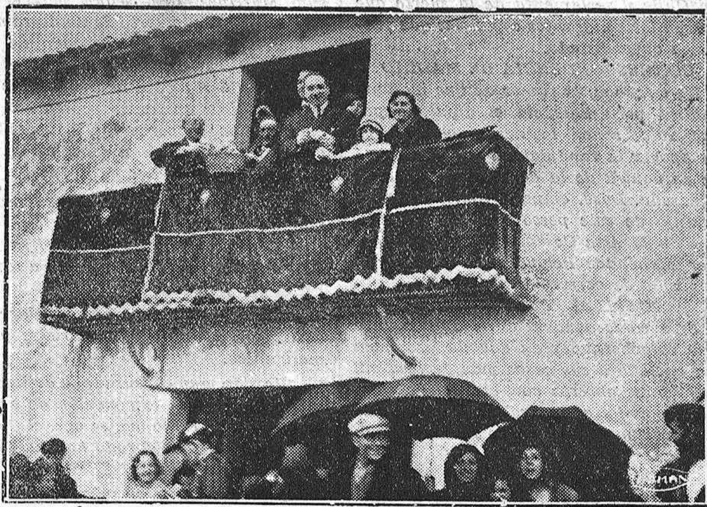
LA FIESTA DE SANTO TORIBIO.—Una lluvia de pan y de queso cae en abundancia sobre los devotos