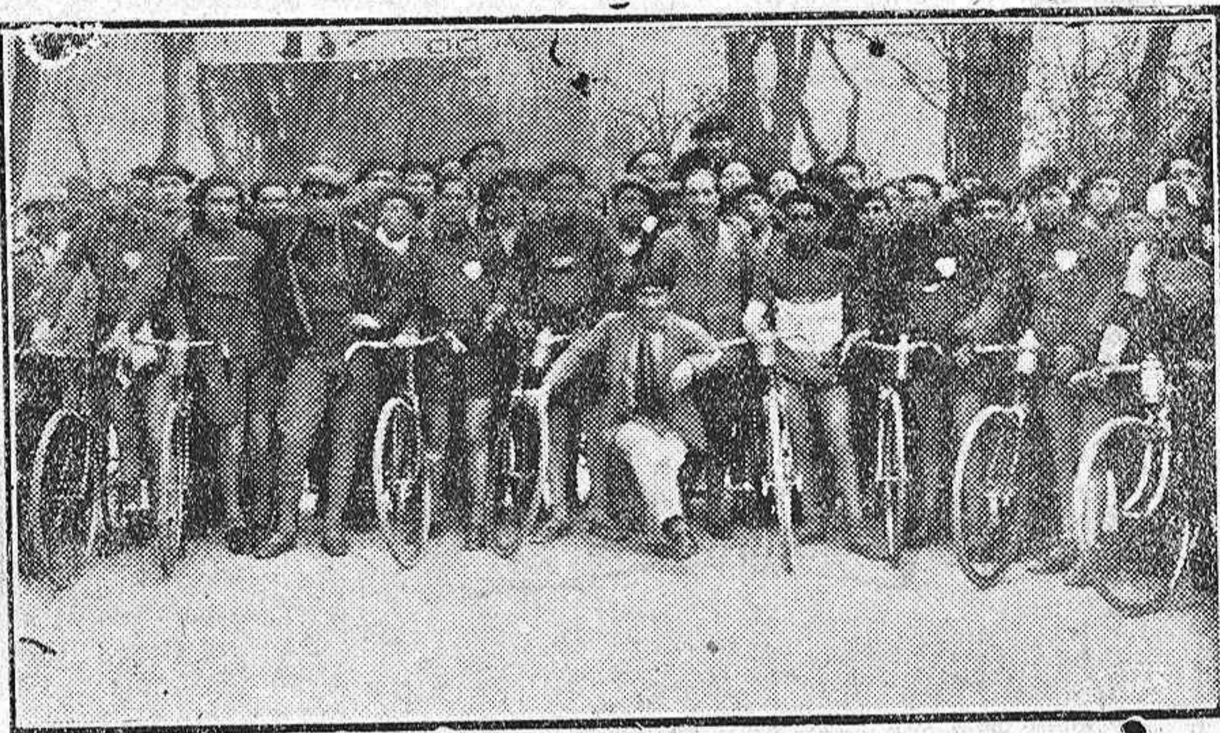
DE CICLISMO.—Corredores que tomaron parte en la prueba del domingo

EL DIA DE PALENCIA, que tantas veces defendió con tenacidad dichos proyectos y que tantas campañas hizo en pro de los mismos, aplaude la labor que en este sentido inicia la Corporación municipal.