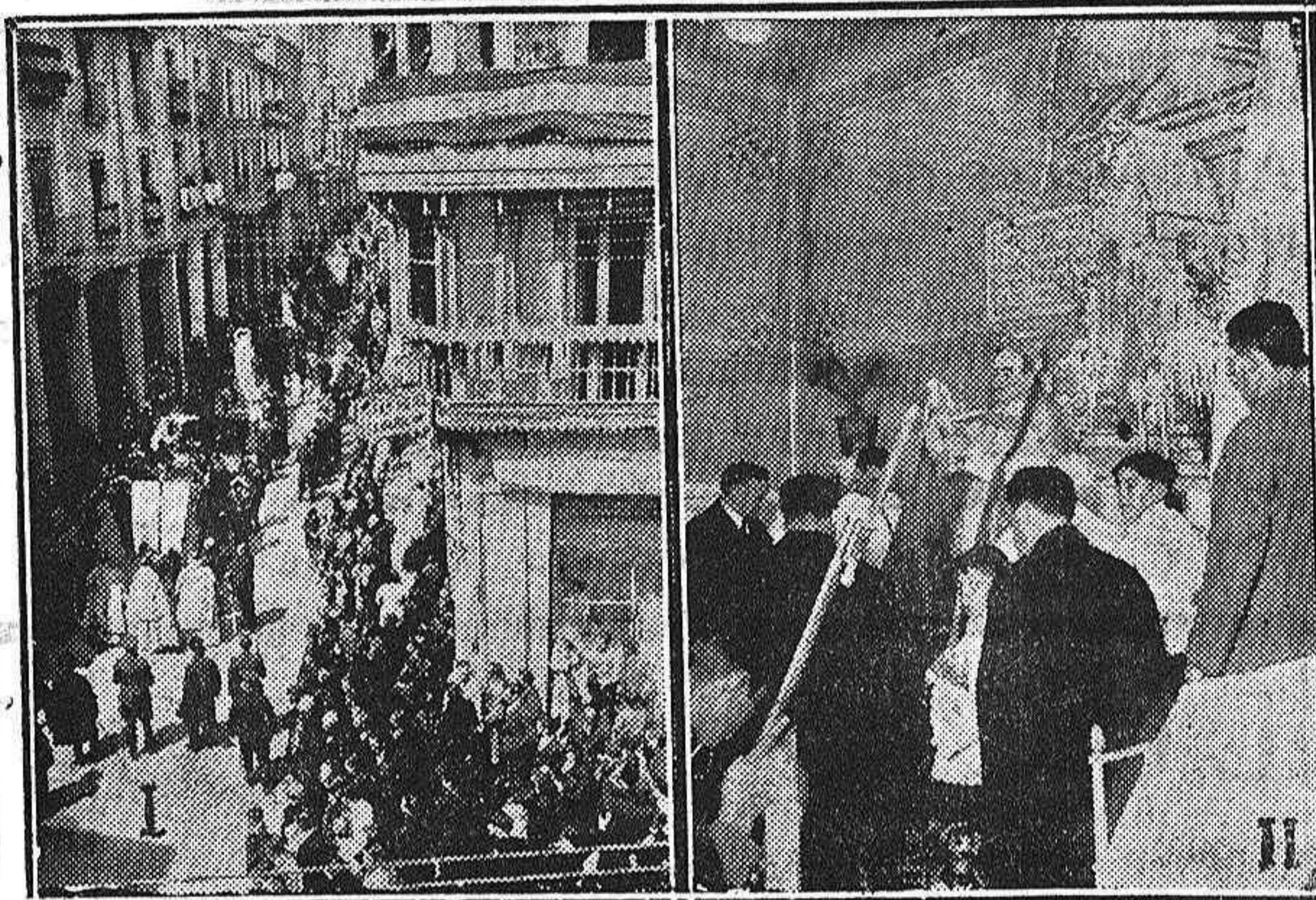
I.—La procesión de Resurrección, a su paso por la calle Mayor II.—El ilustrísimo señor Obispo distribuyendo la Comunión a los enfermos del Hospital