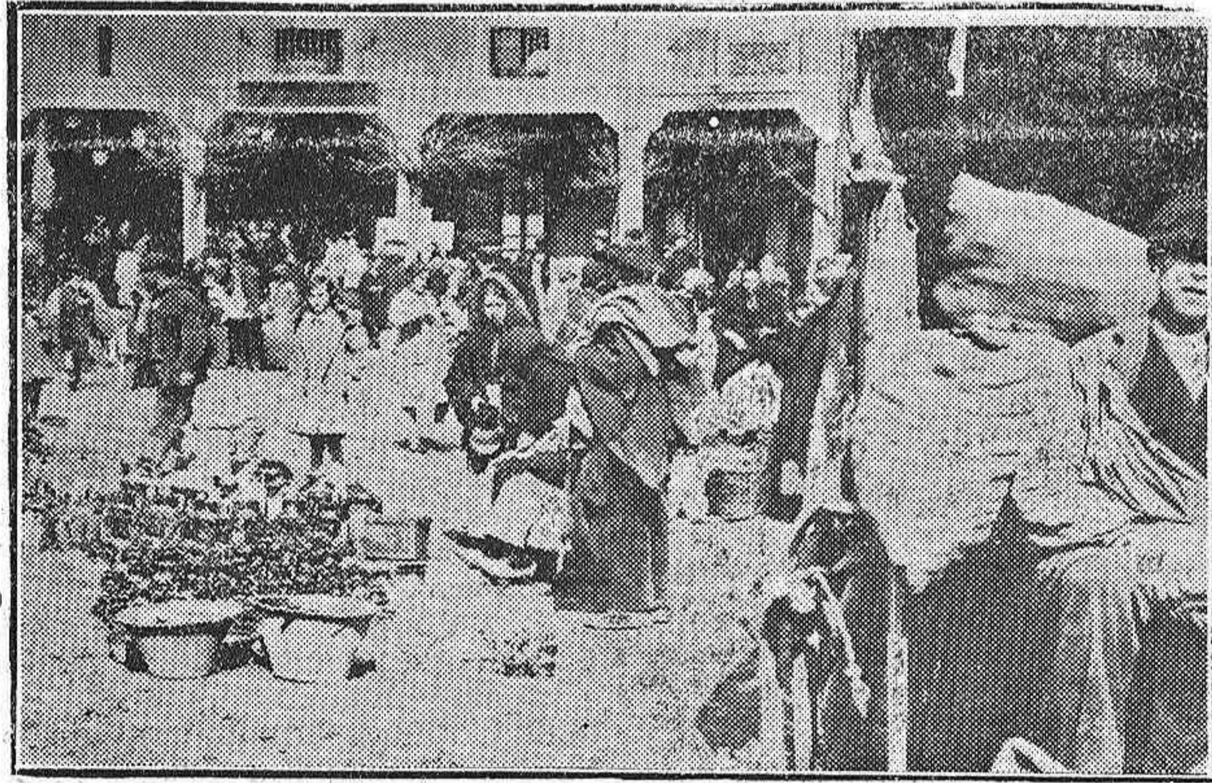
Una feria de Villada

Madrid.—Al abandonar el edificio de la Presidencia esta mañana el general Berenguer manifestó a los periodistas que acababa de avisarle el presidente del Consejo de Administración de la Telefónica, el cual le comunicaba que se había recibido noticias del gran-