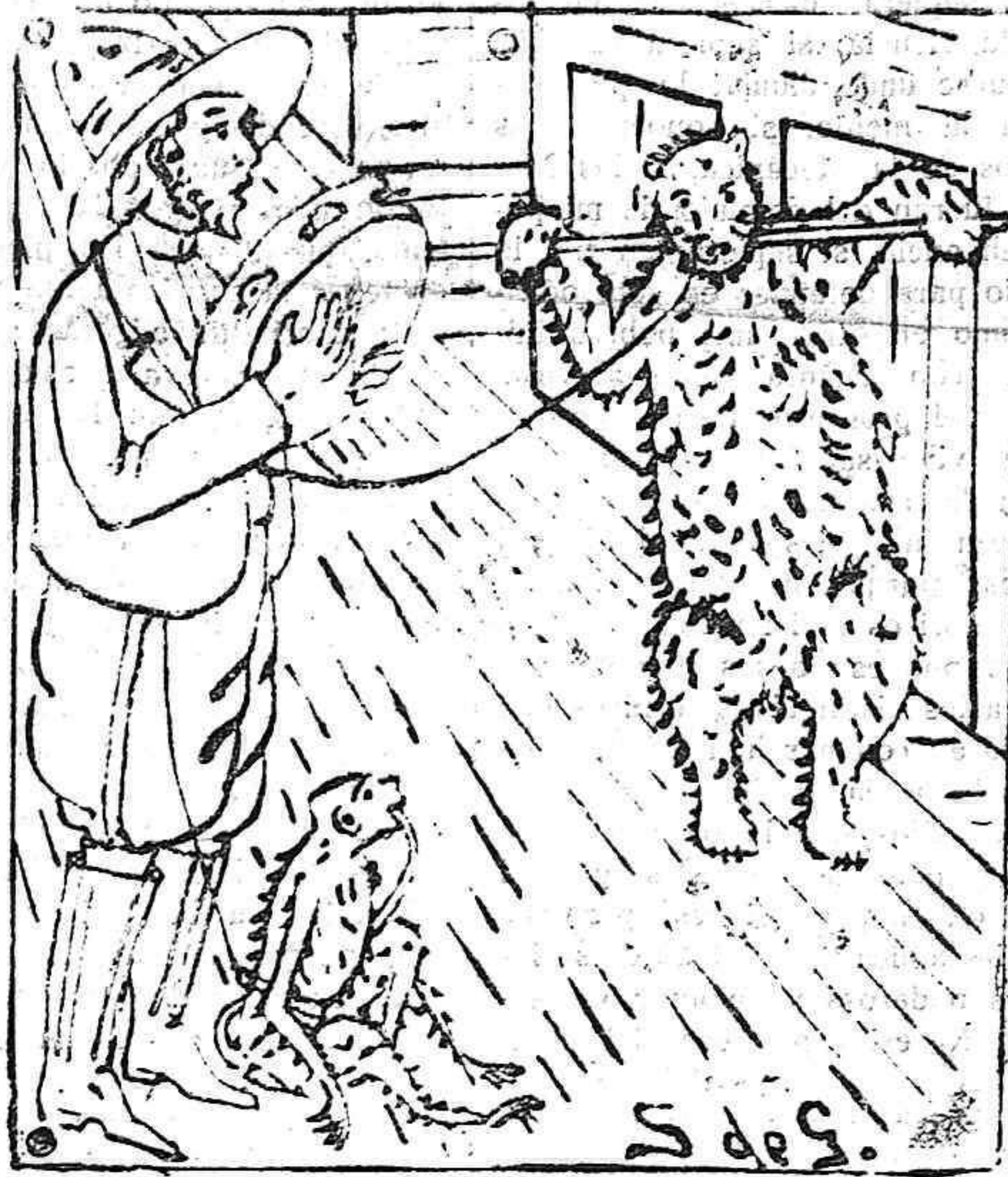
¡Baile la monal... ¡Ande la osal...