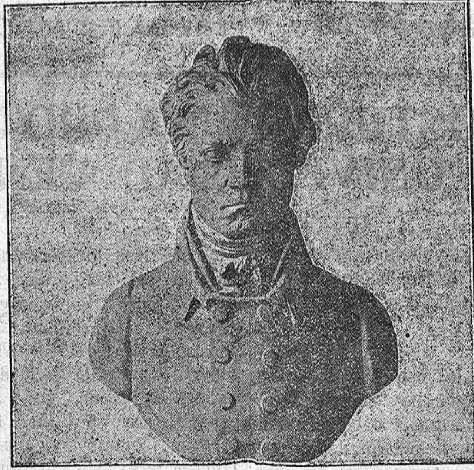
LUIS DE BEETHOVEN