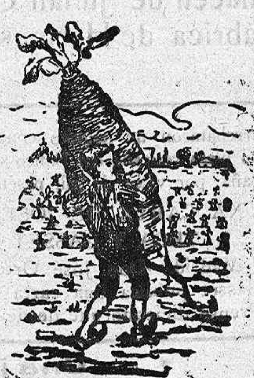
Marca registrada con el núm. 78.208