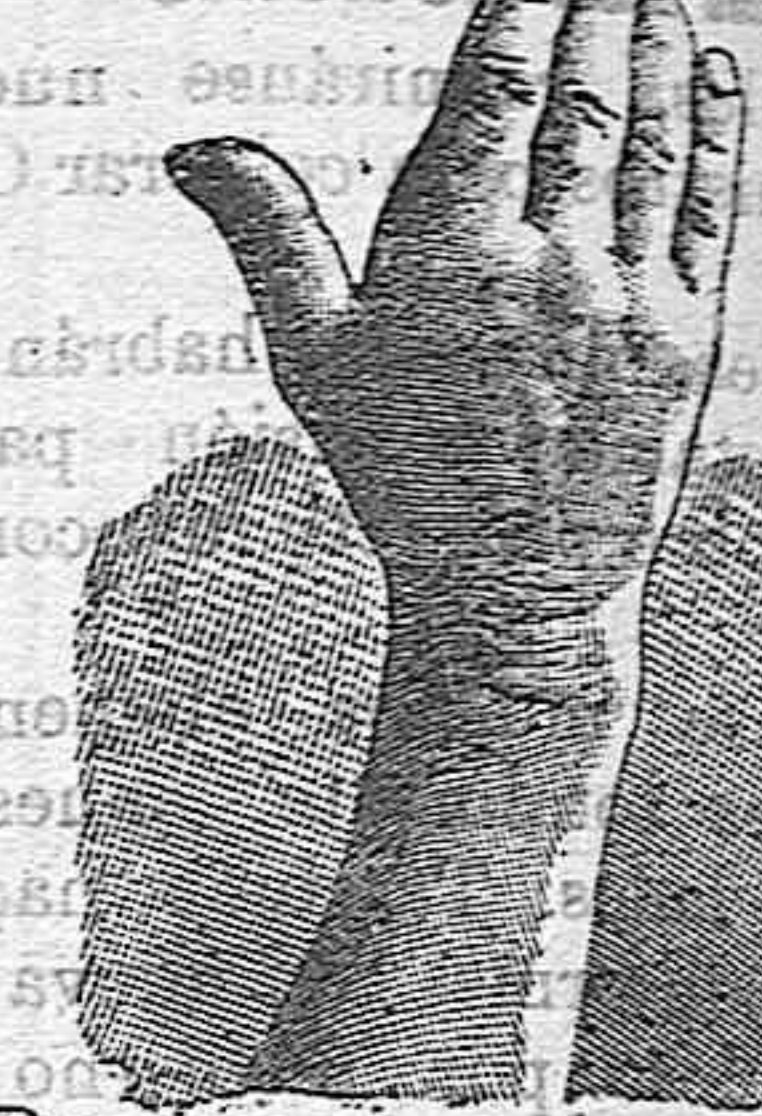
Después de la cura de tratamiento