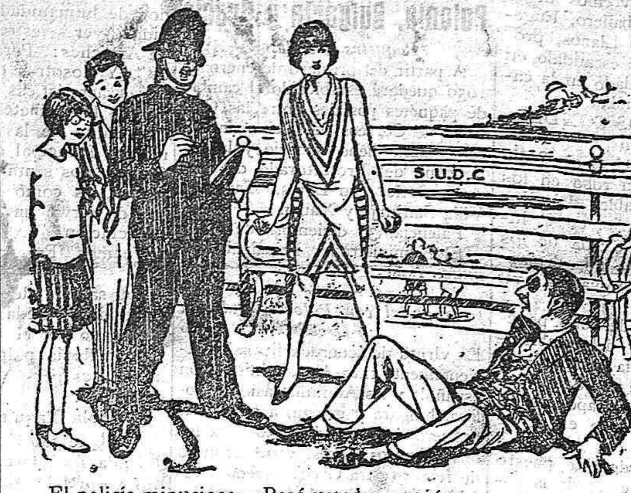
El policia minucioso.—Besó usted a esta jóven antes o después de que ella le diera el puñetazo?

EL DIARIO PALENTINO desea a sus lectores y anunciantes FELIZ AÑO NUEVO No deje de leer nuestro número del próximo día. Así se enterará de los nuevos servicios que establece EL DIARIO PALENTINO.