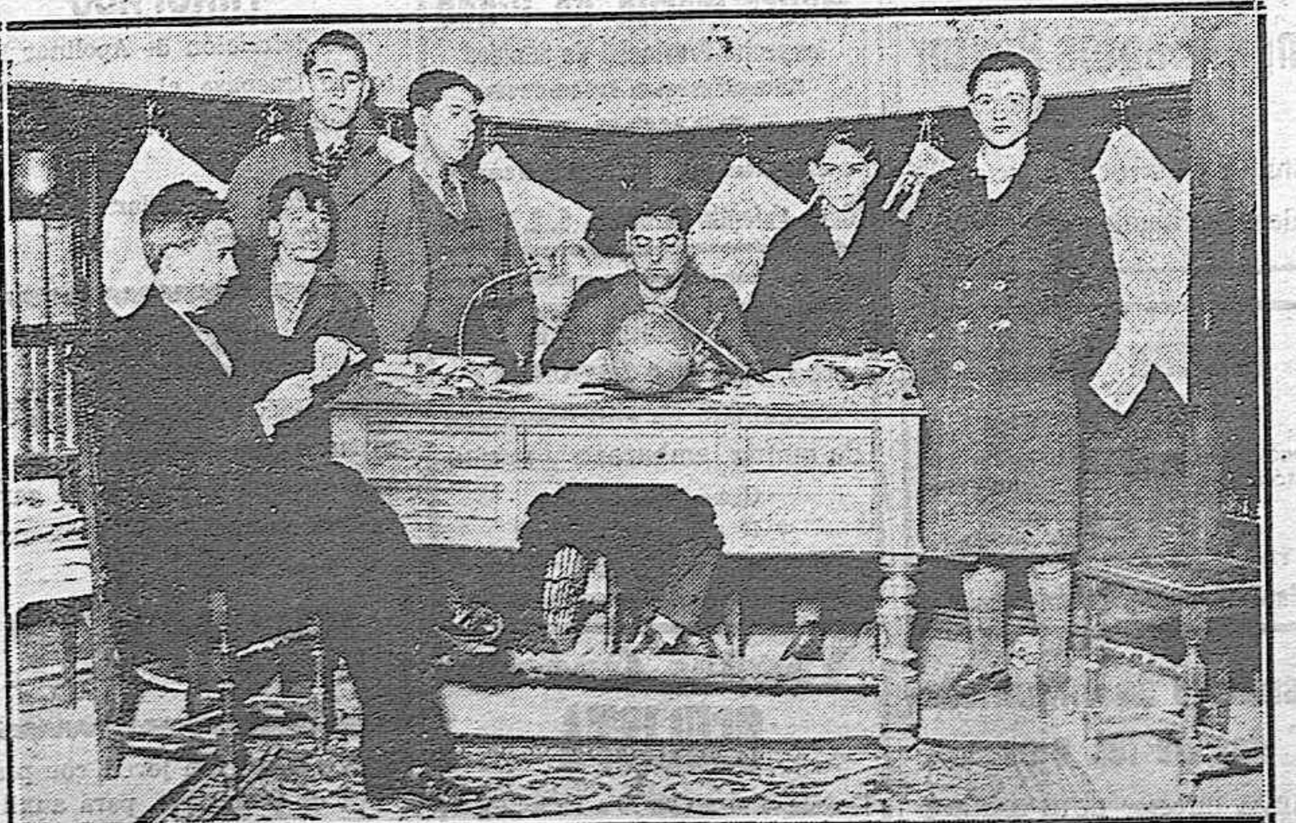
Los participantes del premio destinado al Concurso de Pronósticos, después de presenciar el sorteo que fueron sometidos en nuestra Redacción en la tarde de ayer.