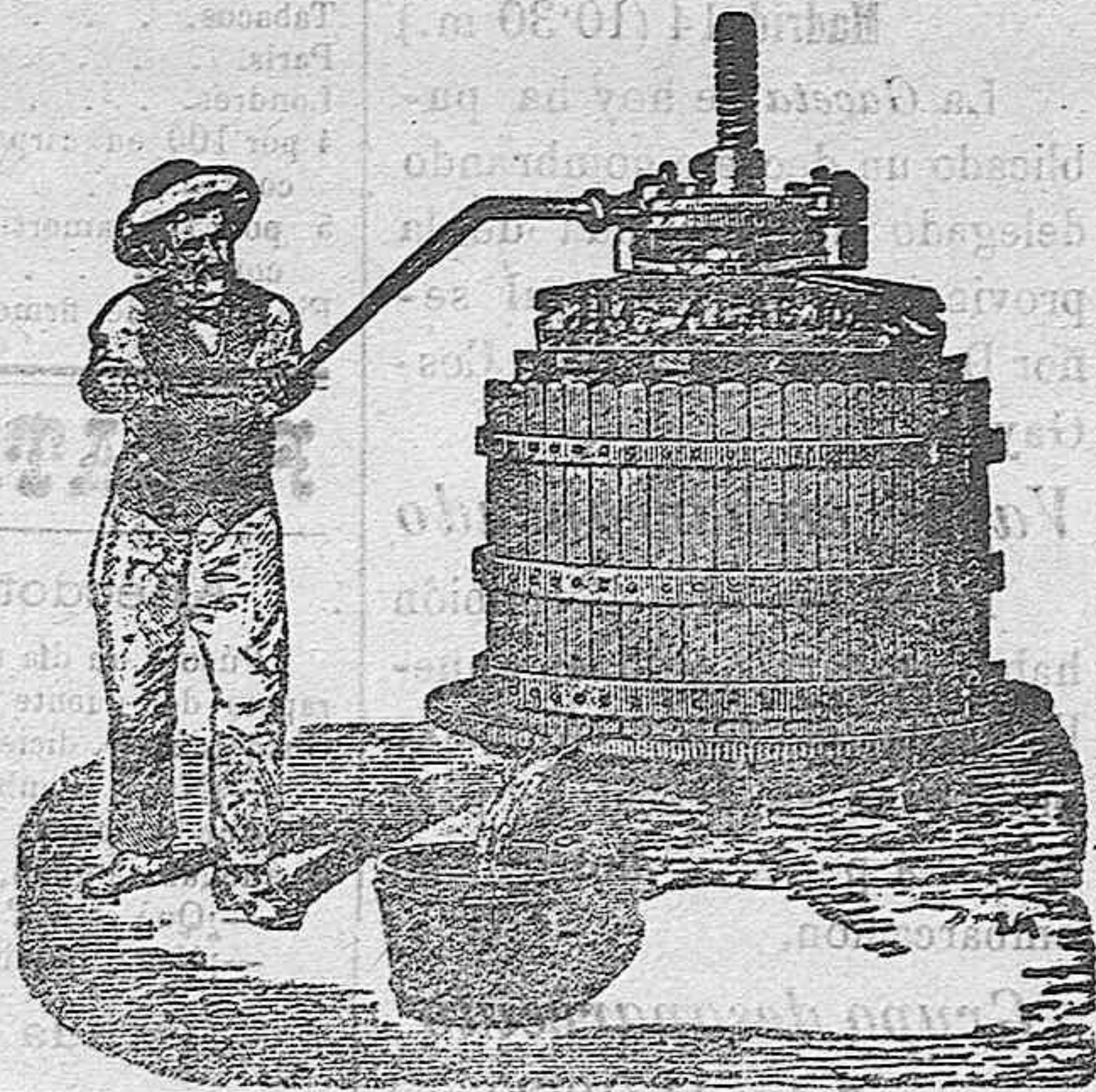
PRESA DE UVA