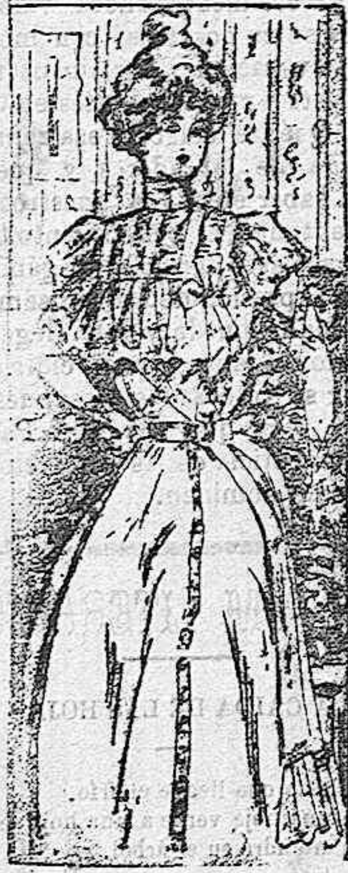
Deshabillé para señora

Modelos exclusivos para nuestras lectoras, de los grandes almacenes de EL SIGLO, Barcelona.