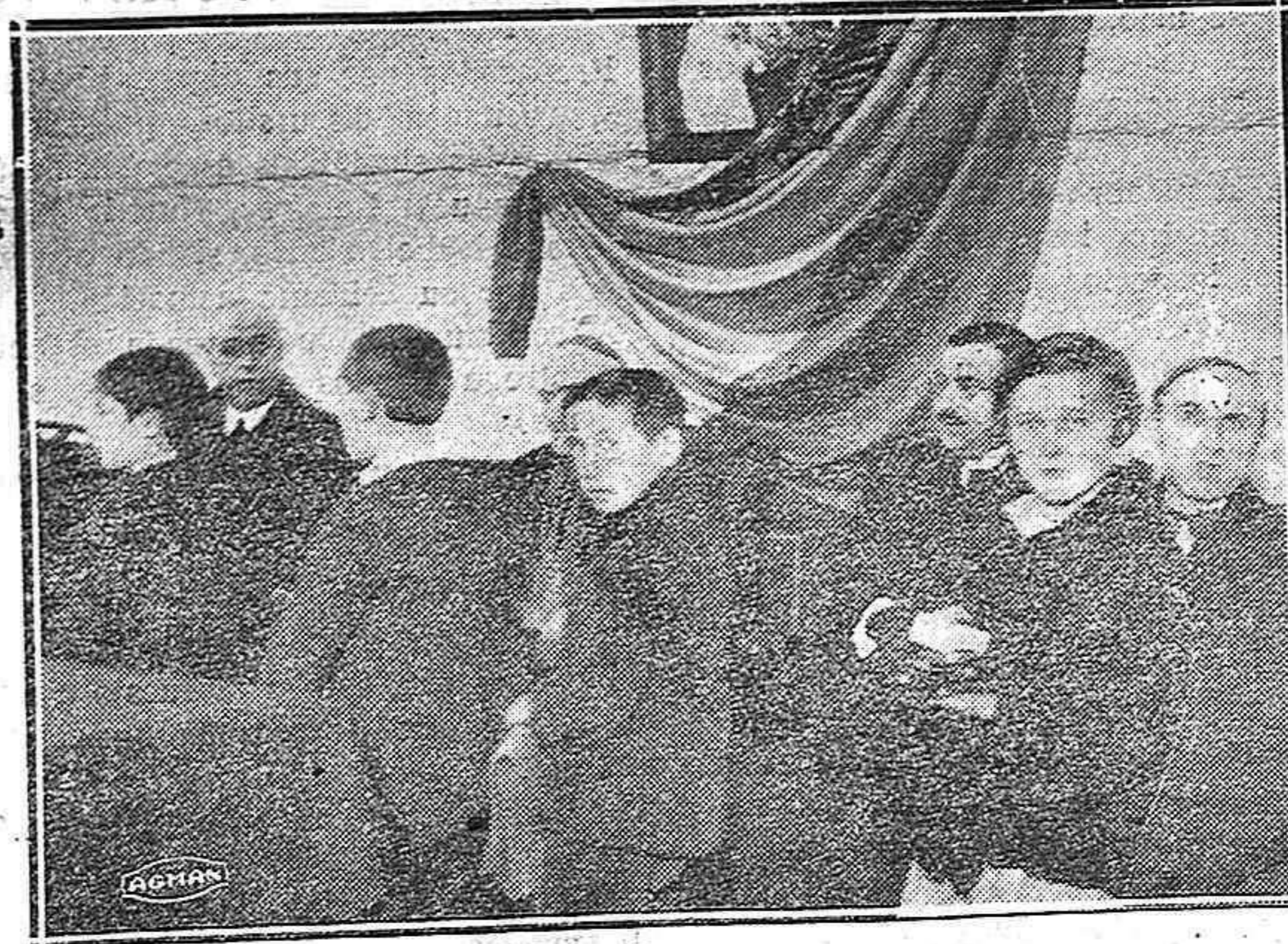
El reparto de premios en las escuelas de San Miguel.—Los niños dan las gracias a las autoridades, después de recoger su premio.