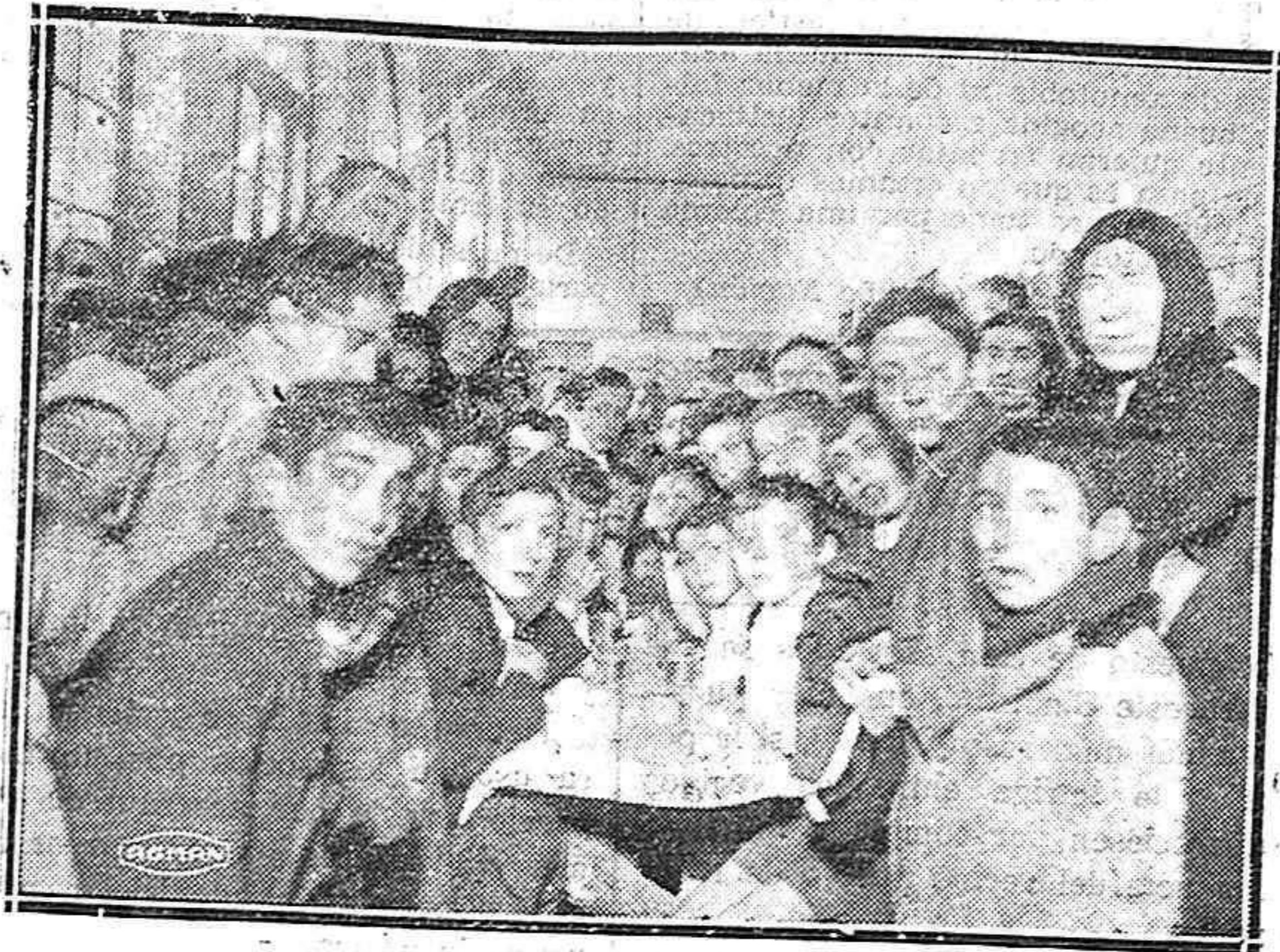
De la fiesta de ayer en San Miguel.—Después de recoger el premio, fueron obsequiados con un suculento banquete en el comedor escolar.