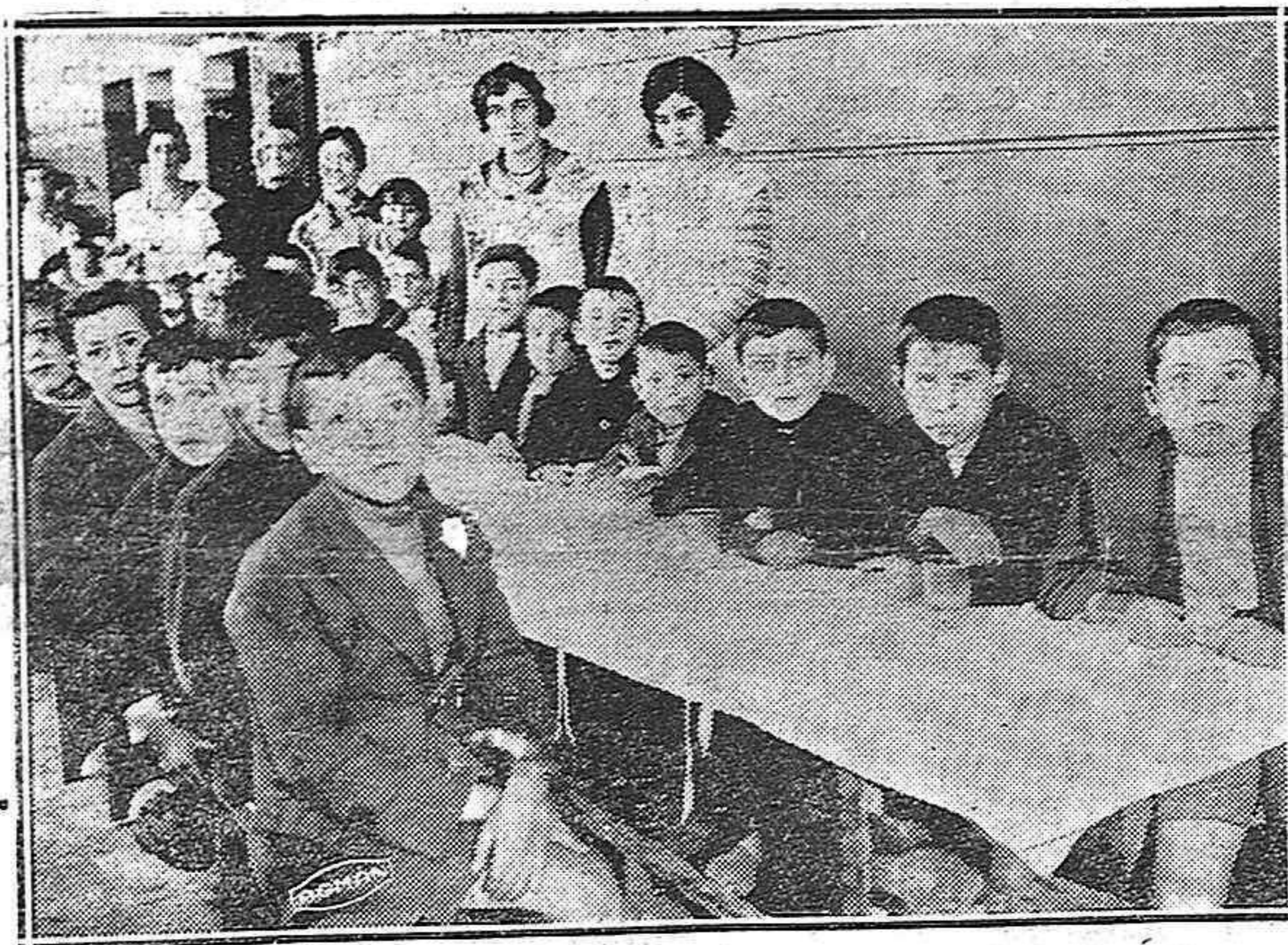
EN EL COMEDOR ESCOLAR.—También a los chicos toca su vez en el halago y en el plato

Existe materia prima en cantidad formidable en todas las regiones españolas, para «comer sabrosísimo». Todas tienen «tesoros gastronómicos»; todas pueden llevar a la cocina manjares propios de exquisito gusto...—Y tiene que ser así, y tuvo que ser así desde las más remotas efemérides, porque España fué en la historia como campo de cruce de las razas, al que llevaron todas, una a una, para que se confundieran con los «sabores» indígenas, todos los sabores típicos de sus países lejanos.