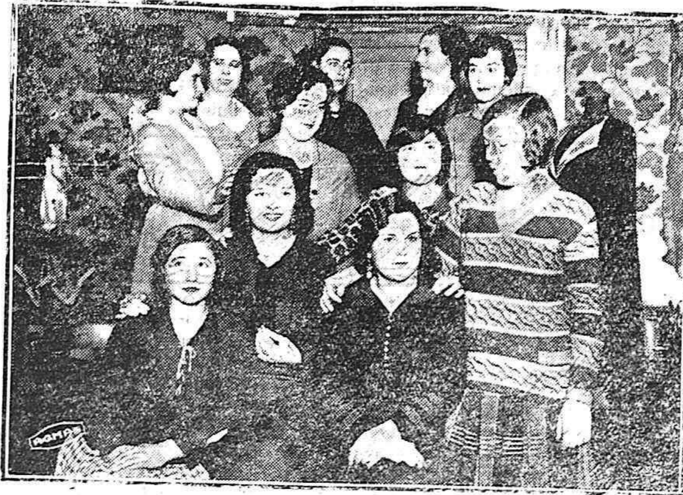
Un taller de modistas palentino. - A él se refiere nuestra información de hoy; son estas lindas muchachas las que hoy nos exponen su opinión sobre unos cuantos problemas que les afectan a todas

Un plantel de jovencitas, donde reina el bisbiseo de la charla jacarandosa y contumaz. Un ir y venir incesante de