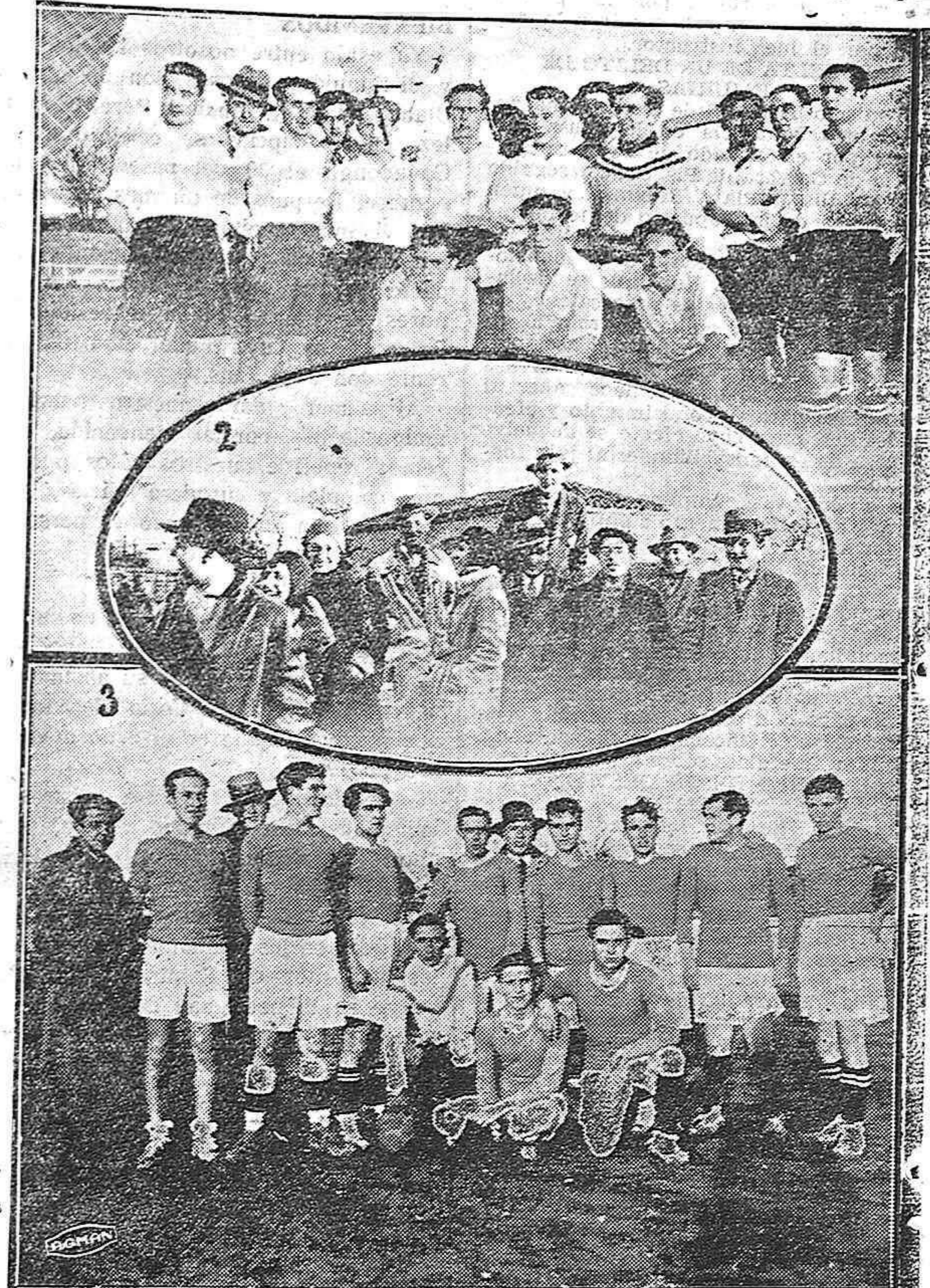
DEL PARTIDO DE AYER.—1.—El Euskalduna 2.—Un grupo de aficionados 3.—El once local, que ayer quedó empatado a 2 con El Euskalduna

Confiamos en que nuestros seleccionadores cuidarán atentamente a la confección del once que luchará el próximo domingo contra el «Sparta», de León, y que el público, que pide partidos asistirá a este.