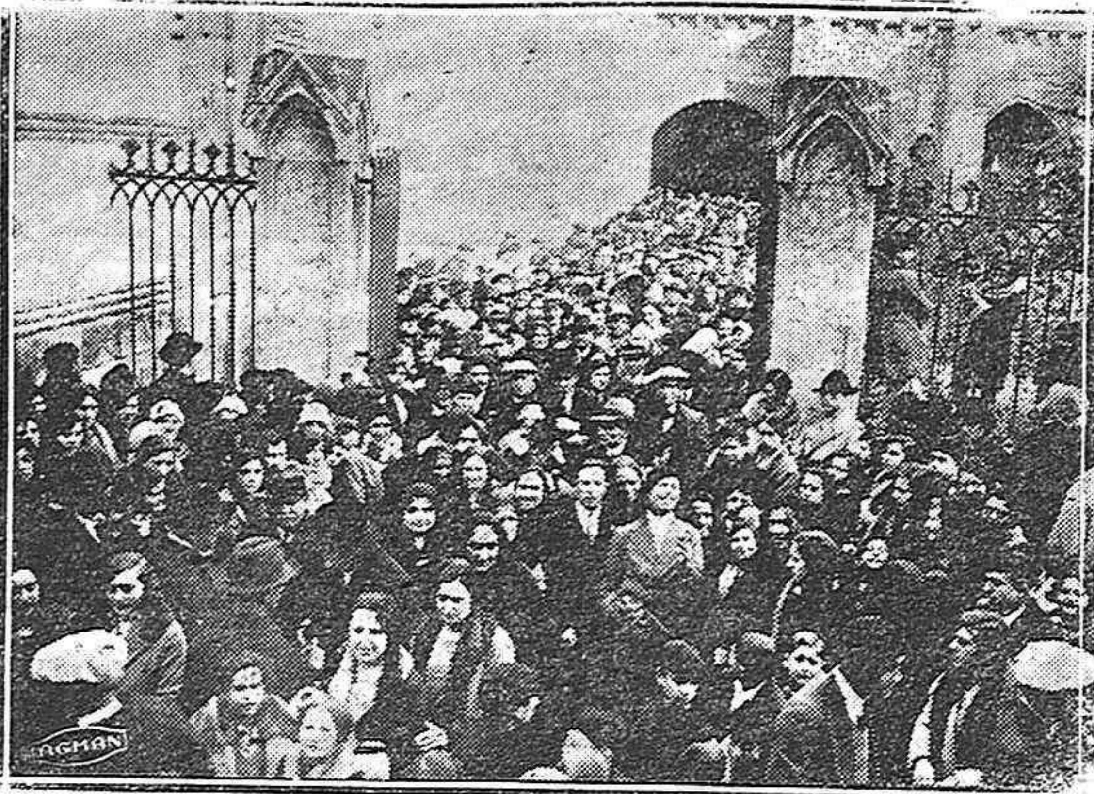
Salida del numeroso público que asistió a la solemne Misa de Santa Cecilia