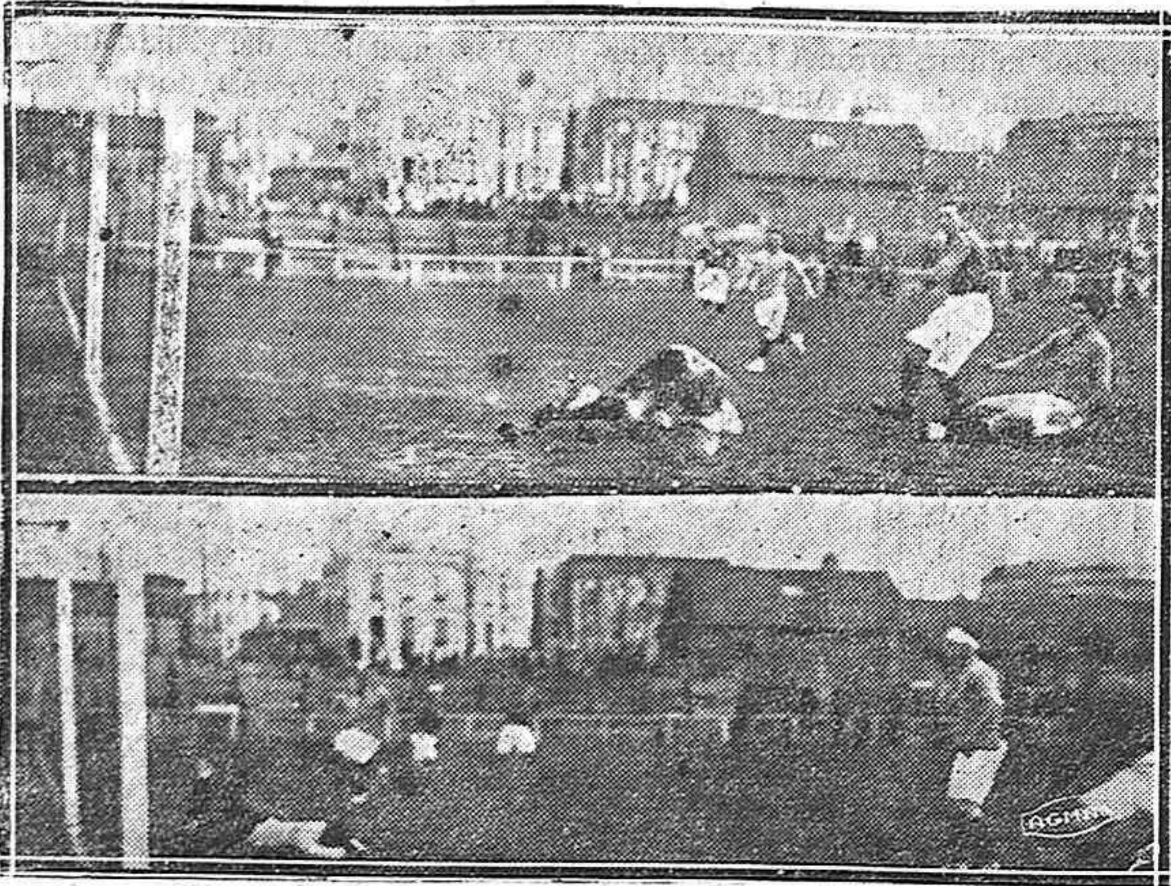
Del partido de ayer en León.—Una estirada de Piera.—Momento de peligro en la portería del Sport.

a las tres hubo que dirigirse en seguida al campo, donde una vez llegados, vistieron nuestros equipiers su "maillot" morado y pantalón blanco.