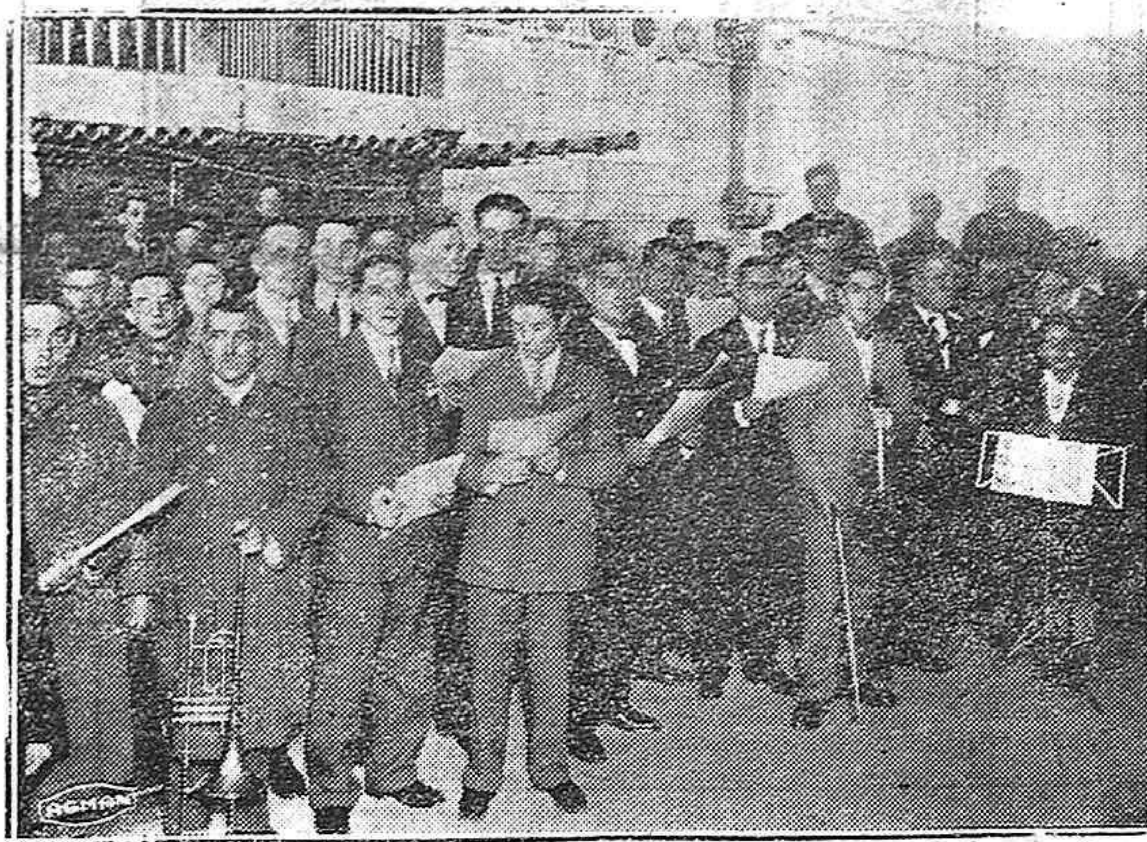
Sres. Profesores de orquesta, banda y miembros de la Coral palentina, que bajo la dirección del maestro Gutiérrez Cabeza, actuaron brillantemente en la Misa en honor a su patrona Santa Cecilia