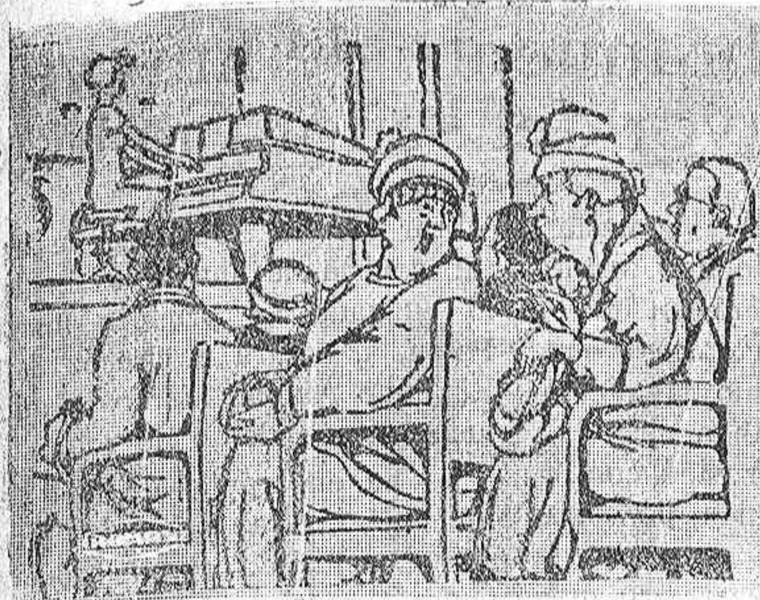
—¿Y usted sabe tocar el piano? —No lo sé; no lo he intentado nunca.