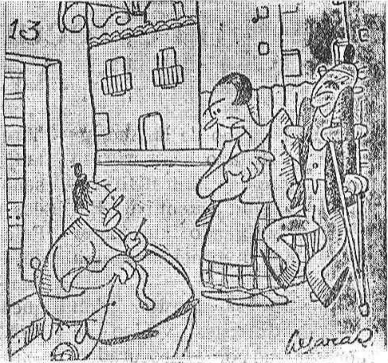
—Ya ve. El pobrecillo está así de un aire... —¿De un aire? Pues hija, parece que lo que le ha dao ha sido un ciclón.