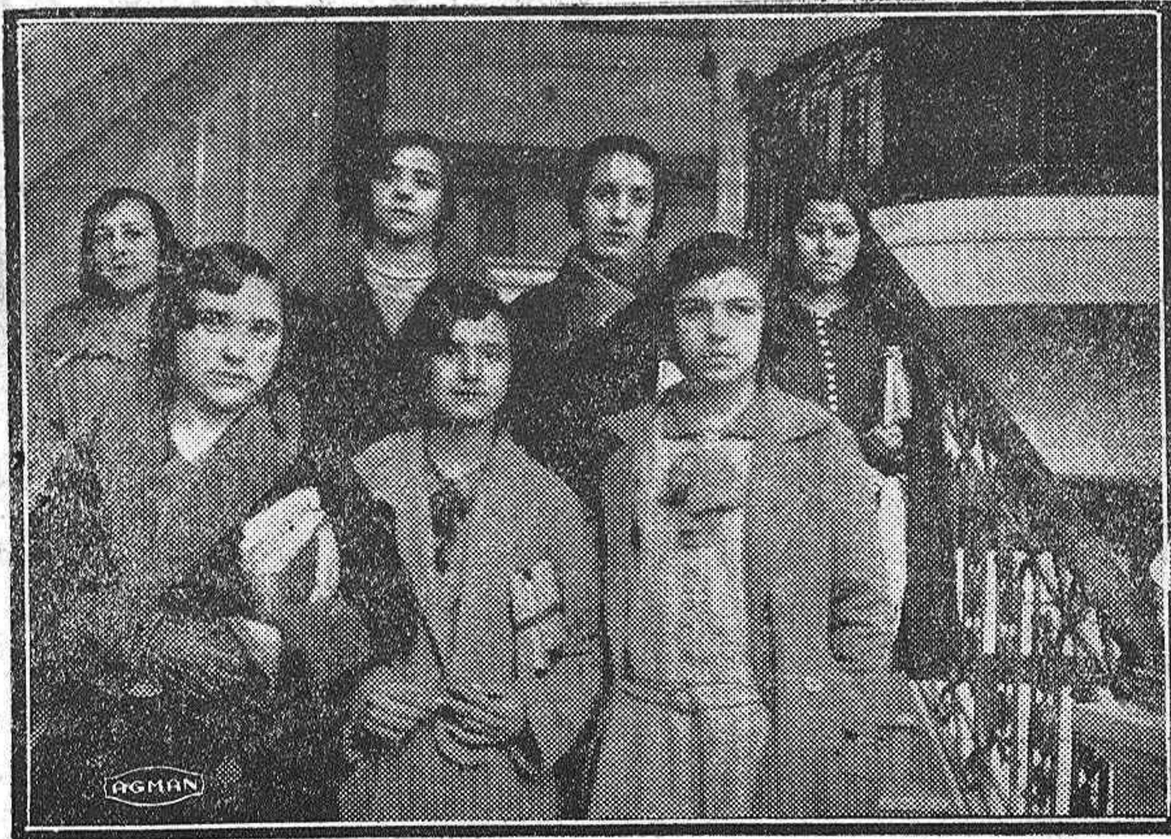
EN EL INSTITUTO.—Las futuras catedráticas.