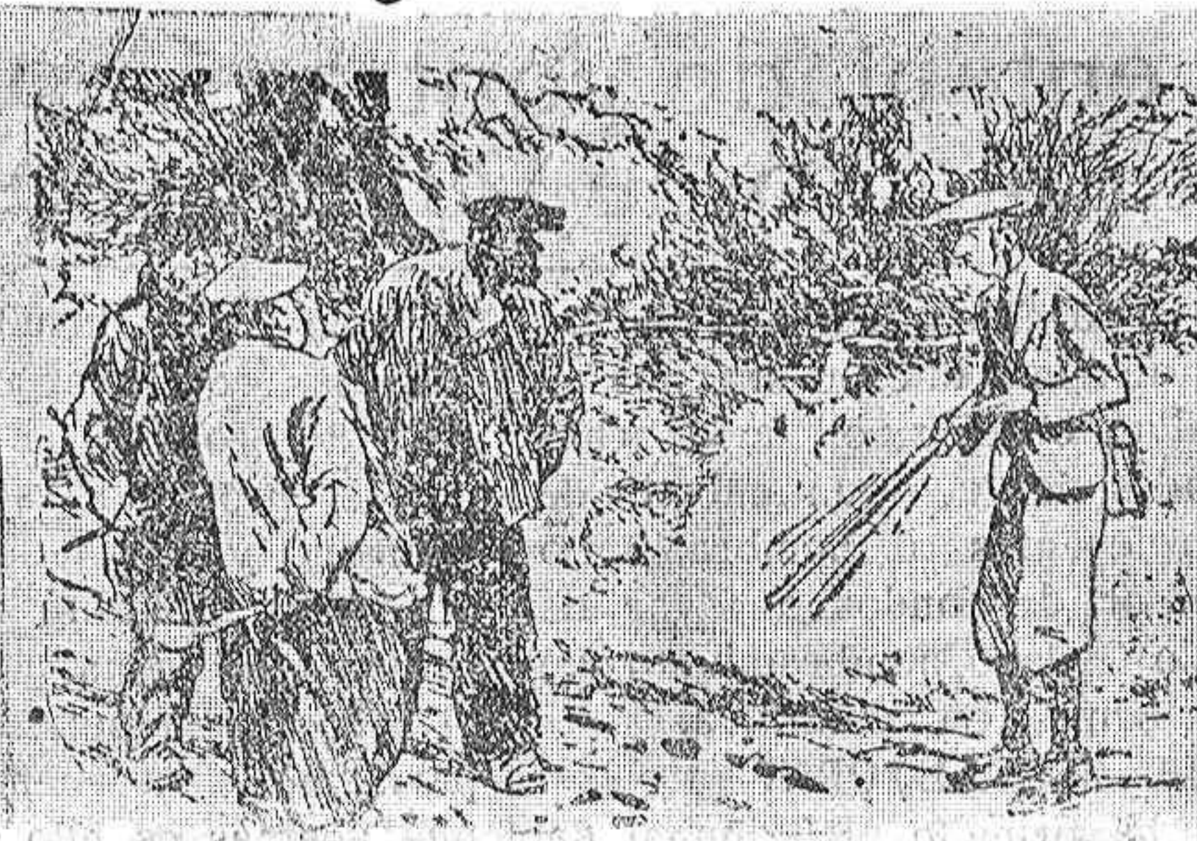
EL «SPORTMAN» (amedrentado, pero fingiendo entereza).—¿Ustedes saben que esta escopeta está cargada? EL ATRACADOR.—¡Bah! Ya hemos estado mirando lo bien que tira usted.