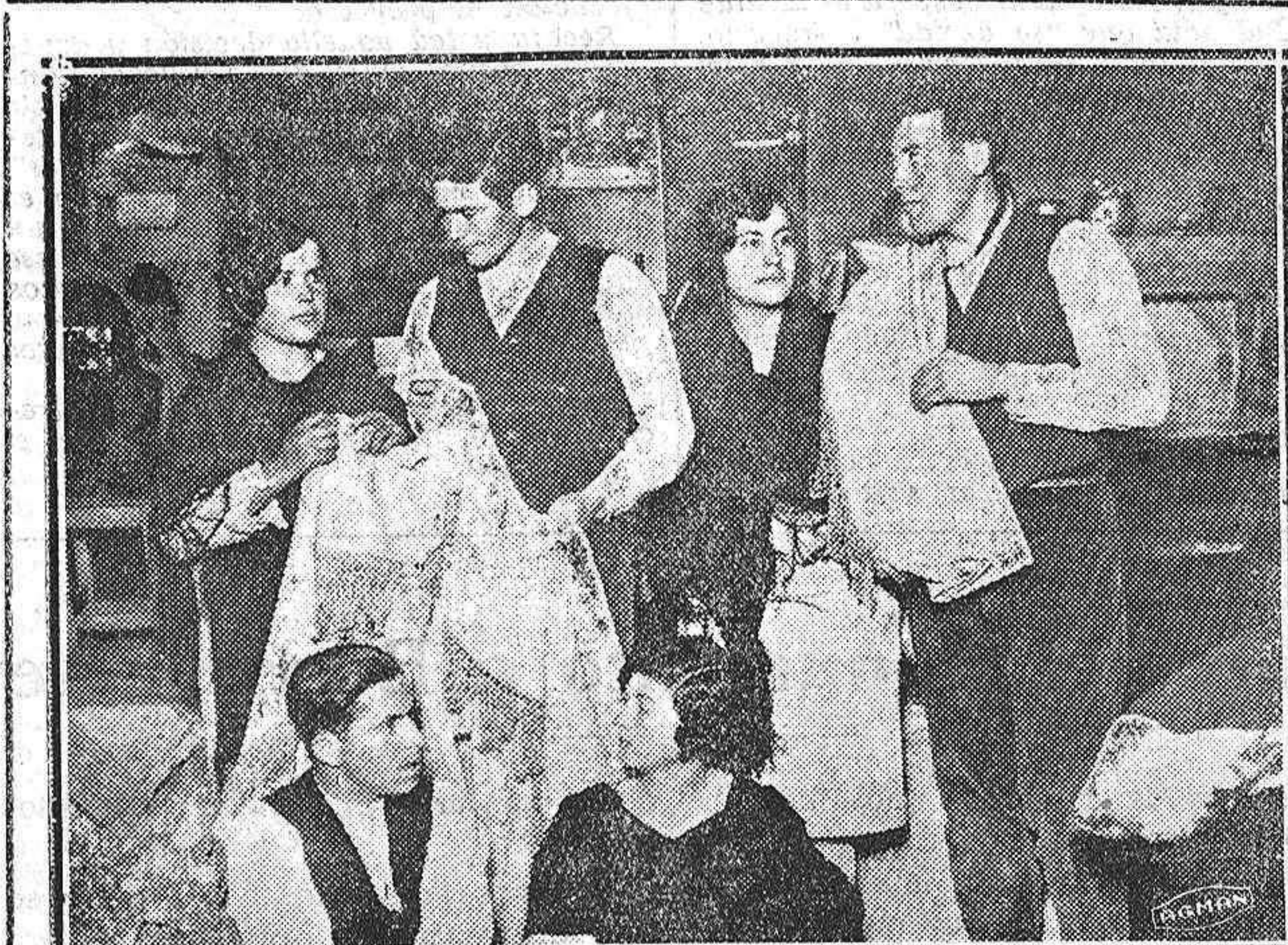
EN LAS HUERTAS BAJAS.—Derrochando buen humor, los castizos huertanos celebraron con toda pompa la tradicional víspera de San Antón.

La causa quedó concluida y pendiente de sentencia.