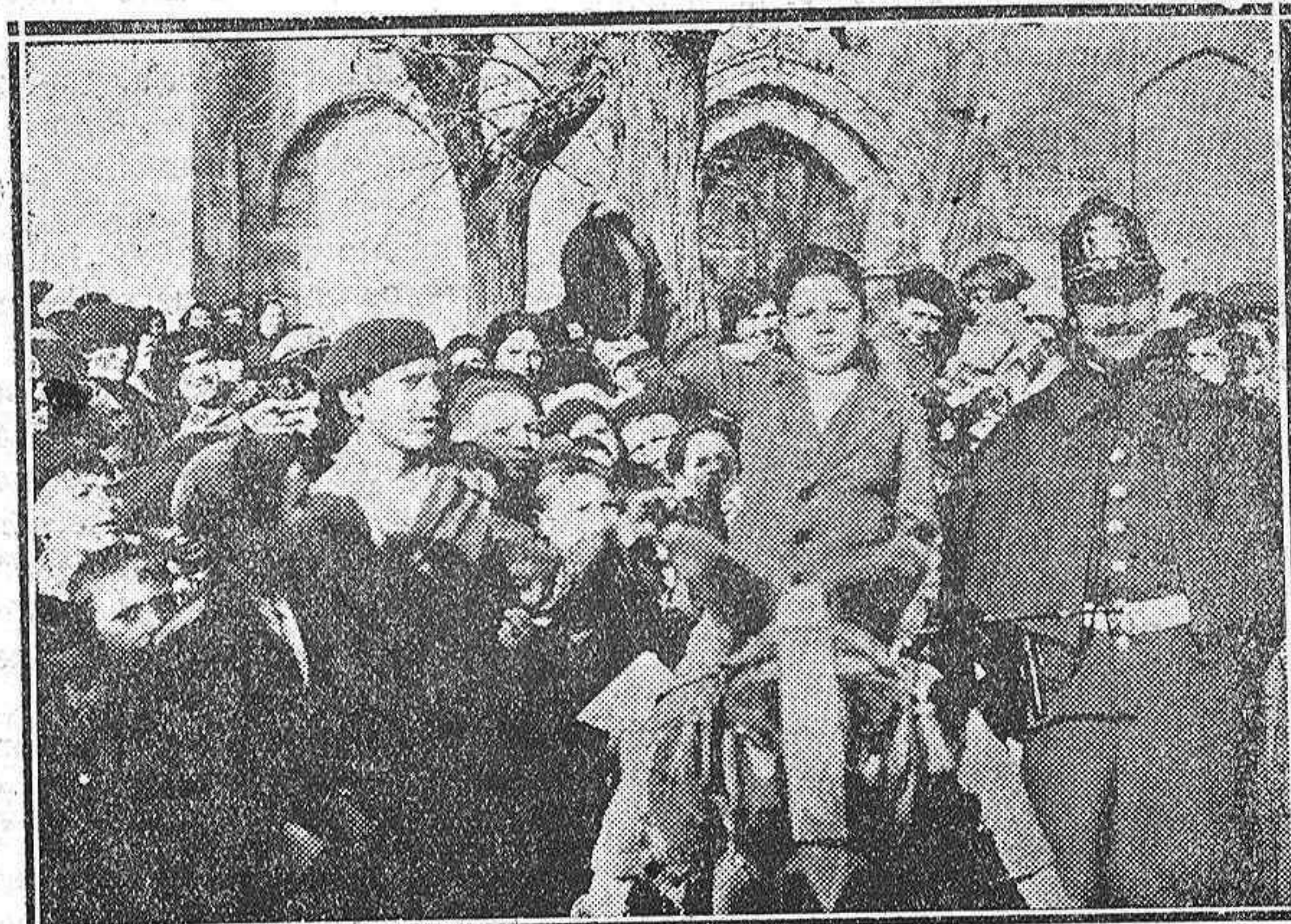
DE LAS FIESTAS DE SAN ANTON.—Un orador espontáneo perora ante el público, pero al lado de un guardia, «por si las moscas».

Madrid.—En la «Gaceta» de hoy aparece una numerosa firma del Ministerio de Marina, toda ella relacionada con el cambio de personal.