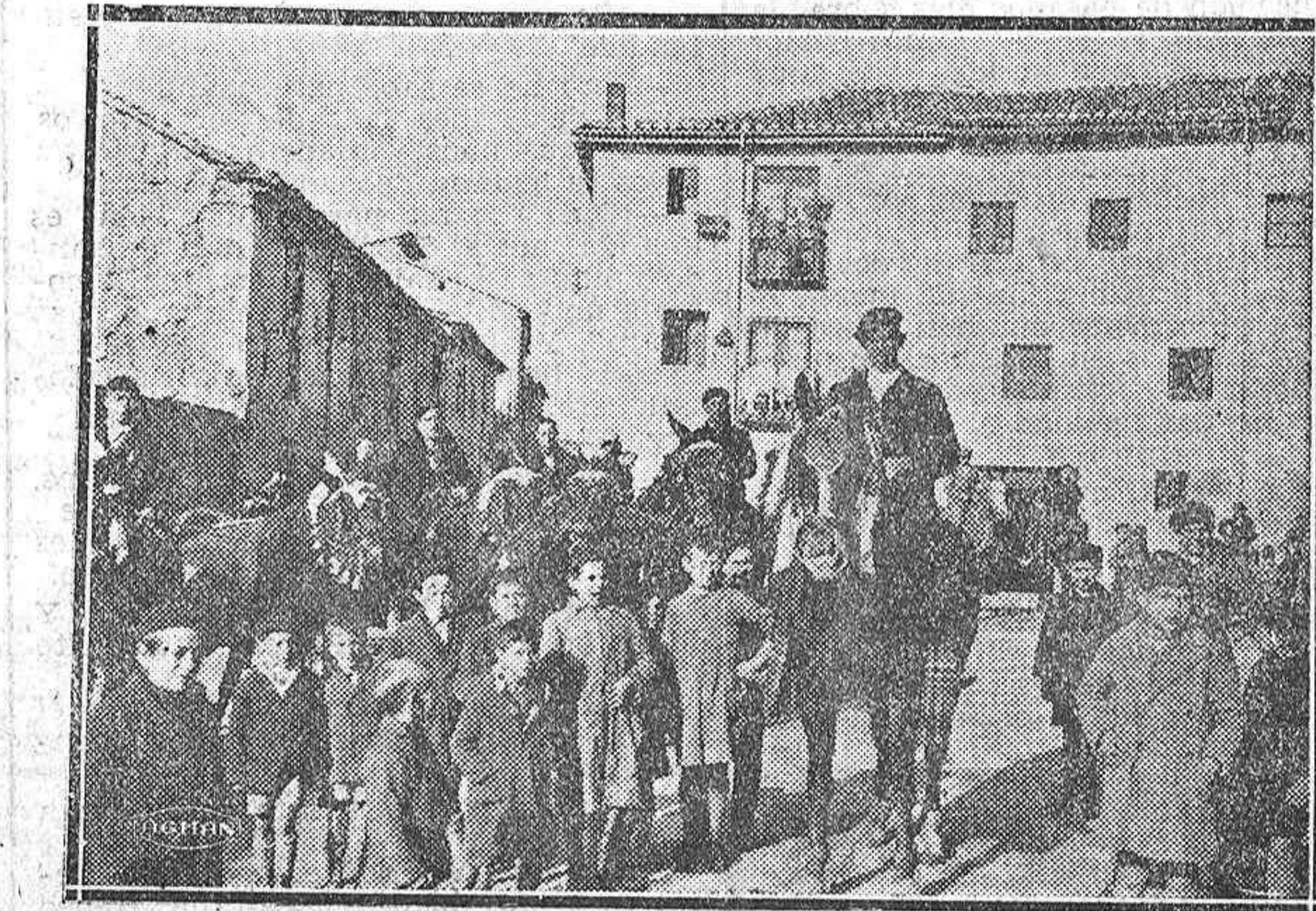
LA FIESTA DE SAN ANTÓN.—Hay vinieron de los pueblos próximos testados jinetes, con sus mulos engalanados para lucirlos en la fiesta de San Antón

El juez de Villaviciosa tenía indudablemente una opinión; pero ya habían