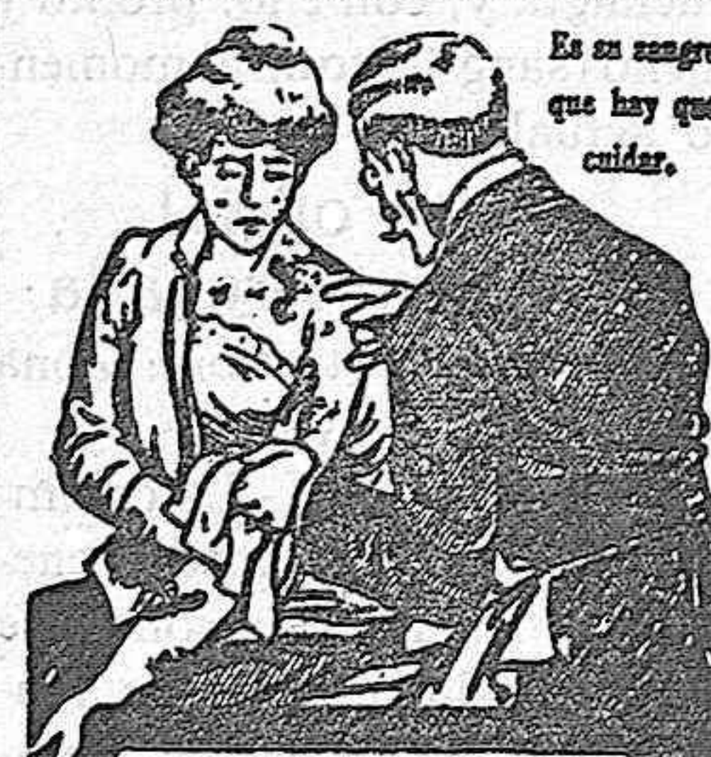
Es en sangre que hay que curar.