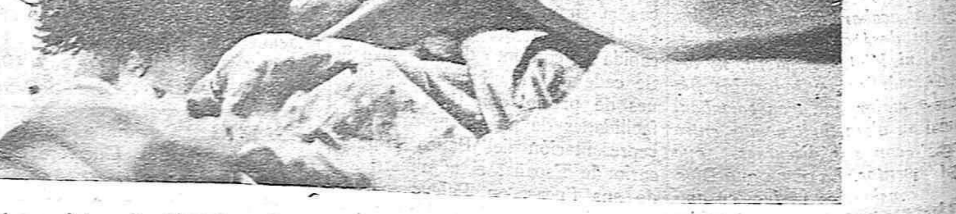
He aquí una fotografía histórica: el cadáver de Calvo Sotelo, sobre la mesa del depósito del Cementerio de Madrid, a la mañana siguiente de su atroz asesinato.

Esta fotografía que fué tomada por un repórter gráfico, en contra de las órdenes dadas por las autoridades del Frente Popular, no pudo ser publicada en ningún periódico español hasta iniciado el glorioso Movimiento Nacional.