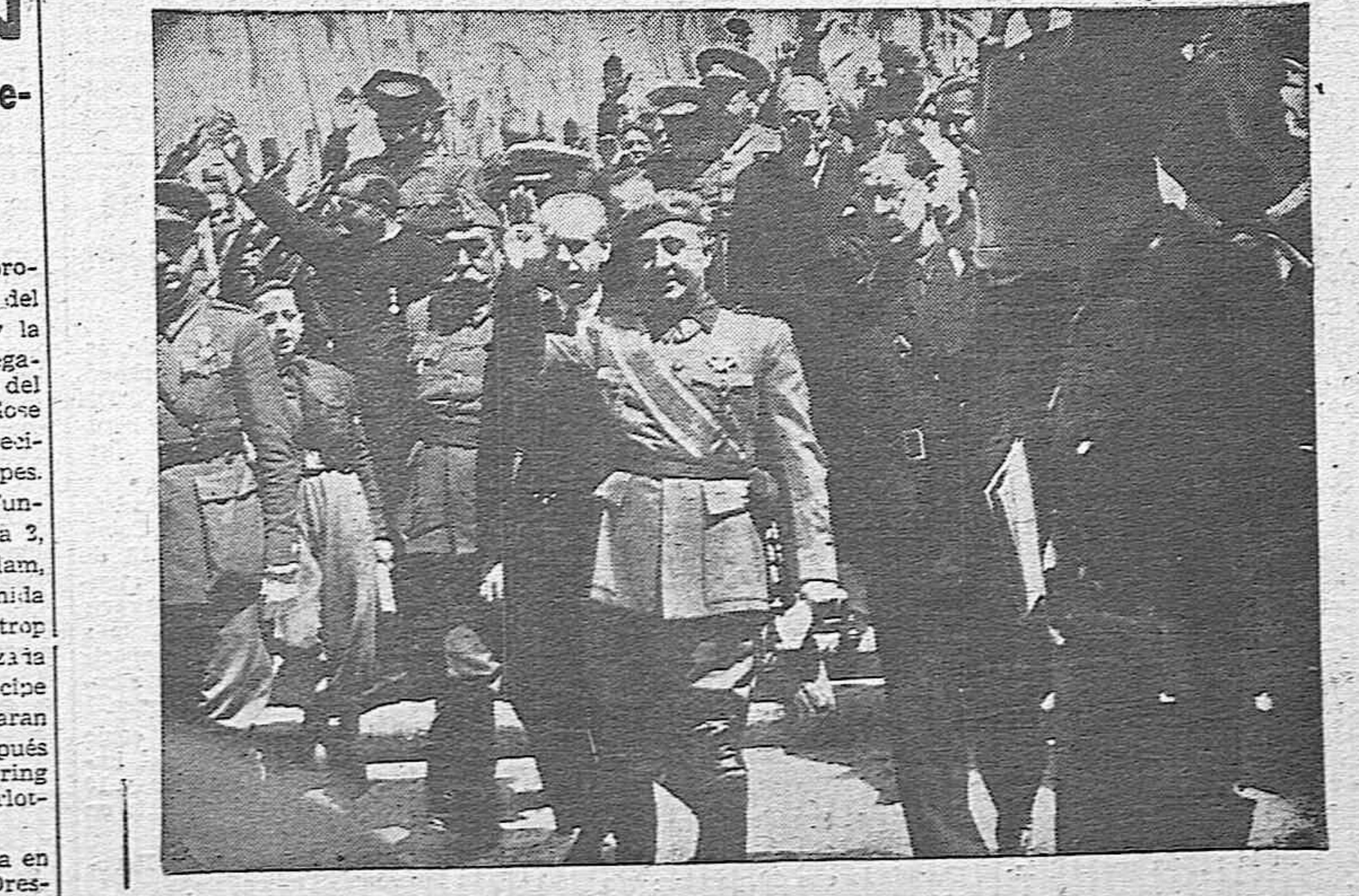
MADRID.—El Generalísimo Franco sale, acompañado de su Gobierno y de los jefes de sus Ejércitos, de la iglesia de las Salesas Reales, después de la ofrenda de su espada al Altísimo