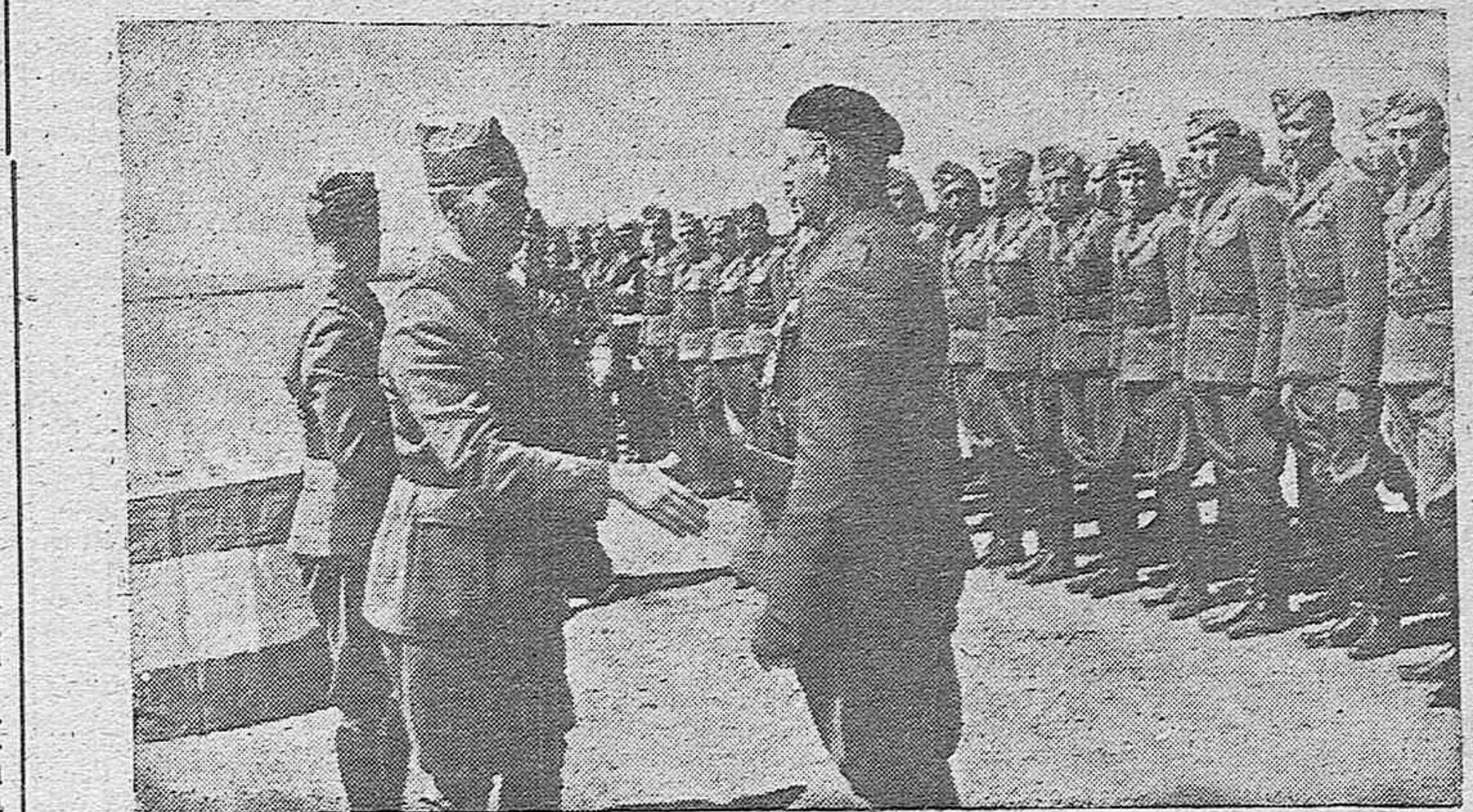
LEON.—El jefe de la Legión Cóndor, general Richthofen, imponiendo condecoraciones militares españolas a los aviadores alemanes más distinguidos durante la guerra.