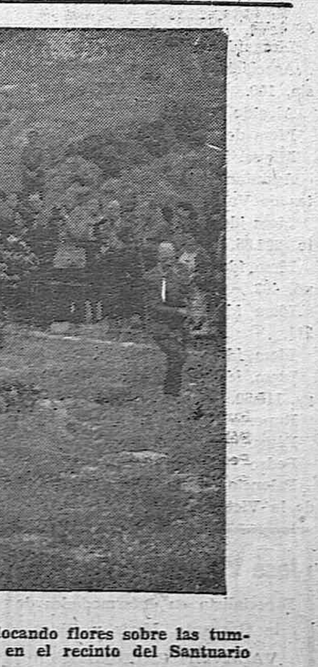
El Generalísimo Franco y los generales Dávila y Queipo de Llano, colocando flores sobre las tumbas de los heroicos defensores en el pequeño Cementerio construido en el recinto del Santuario de Santa María de la Cabeza.