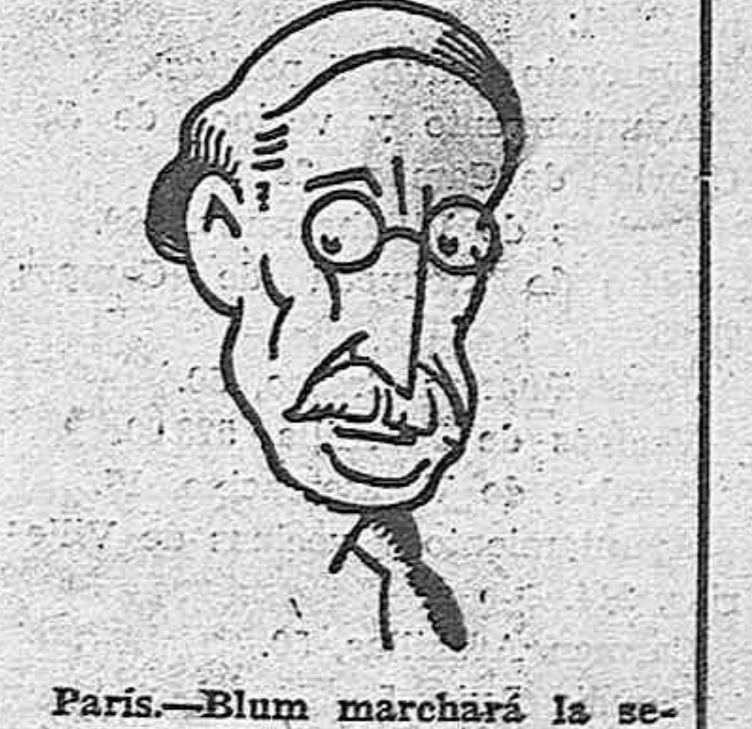
Paris.—Blum marchará la semana próxima a Londres, para entrevistarse con el jefe de la oposición y laborista Atlee, y con el ex-ministro Eden y con Churchill.

¿POR QUE VA BLUM A LONDRES? Se entrevistará con los belicistas Atlee, Eden y Churchill