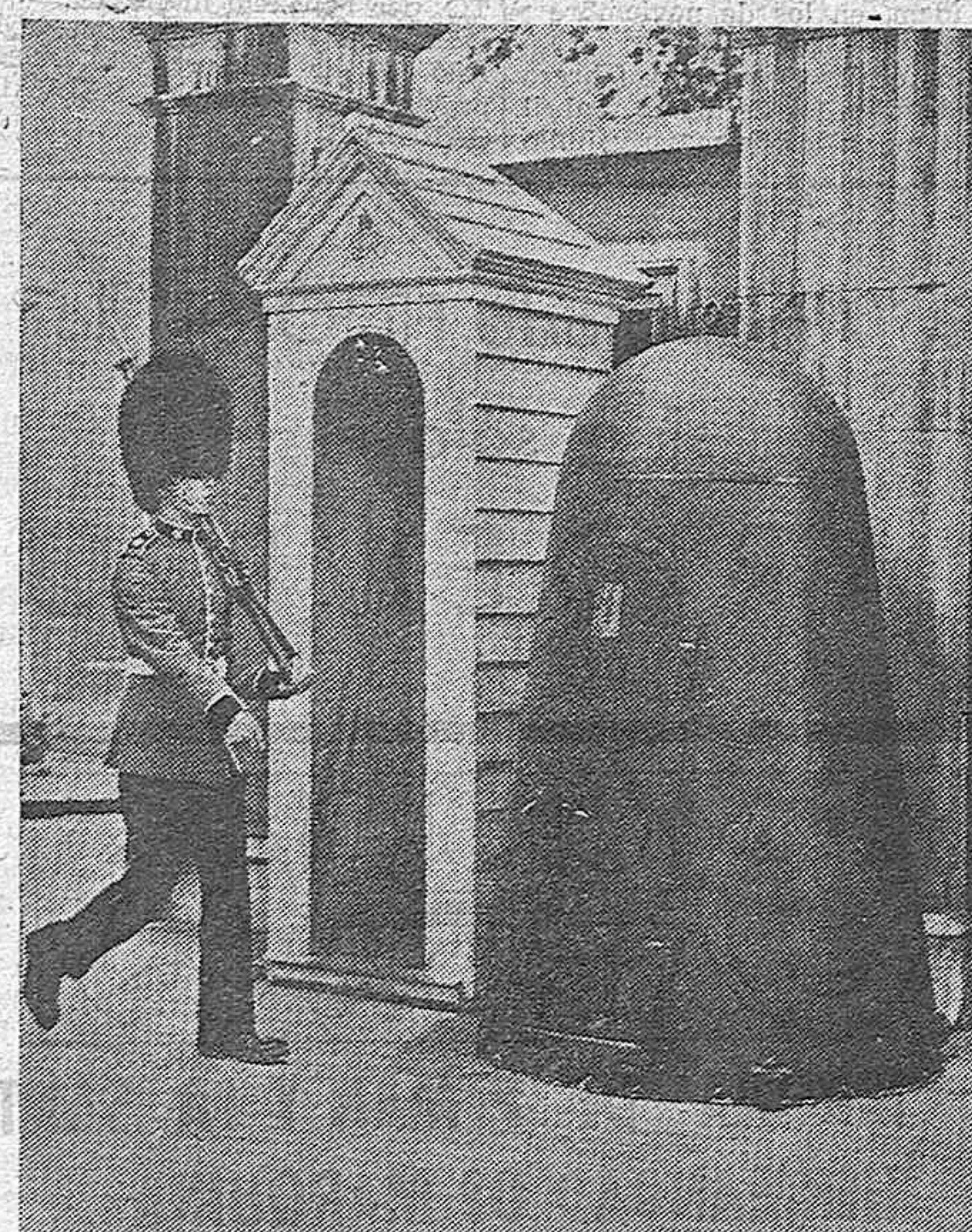
Un centinela inglés al lado de sus garitas la que hasta ahora servía de refugio contra los elementos y la que ha de protegerle contra los bombardeos aéreos.

Las tropas alemanas que han cruzado el Vístula, han llegado a los alrededores de Opole, donde se combate duramente. La aviación alemana ha bombardeado nuevamente la ciudad de Varsovia y la de Lublin, habiendo resultado con grandes daños el Palacio de la Nunciatura.