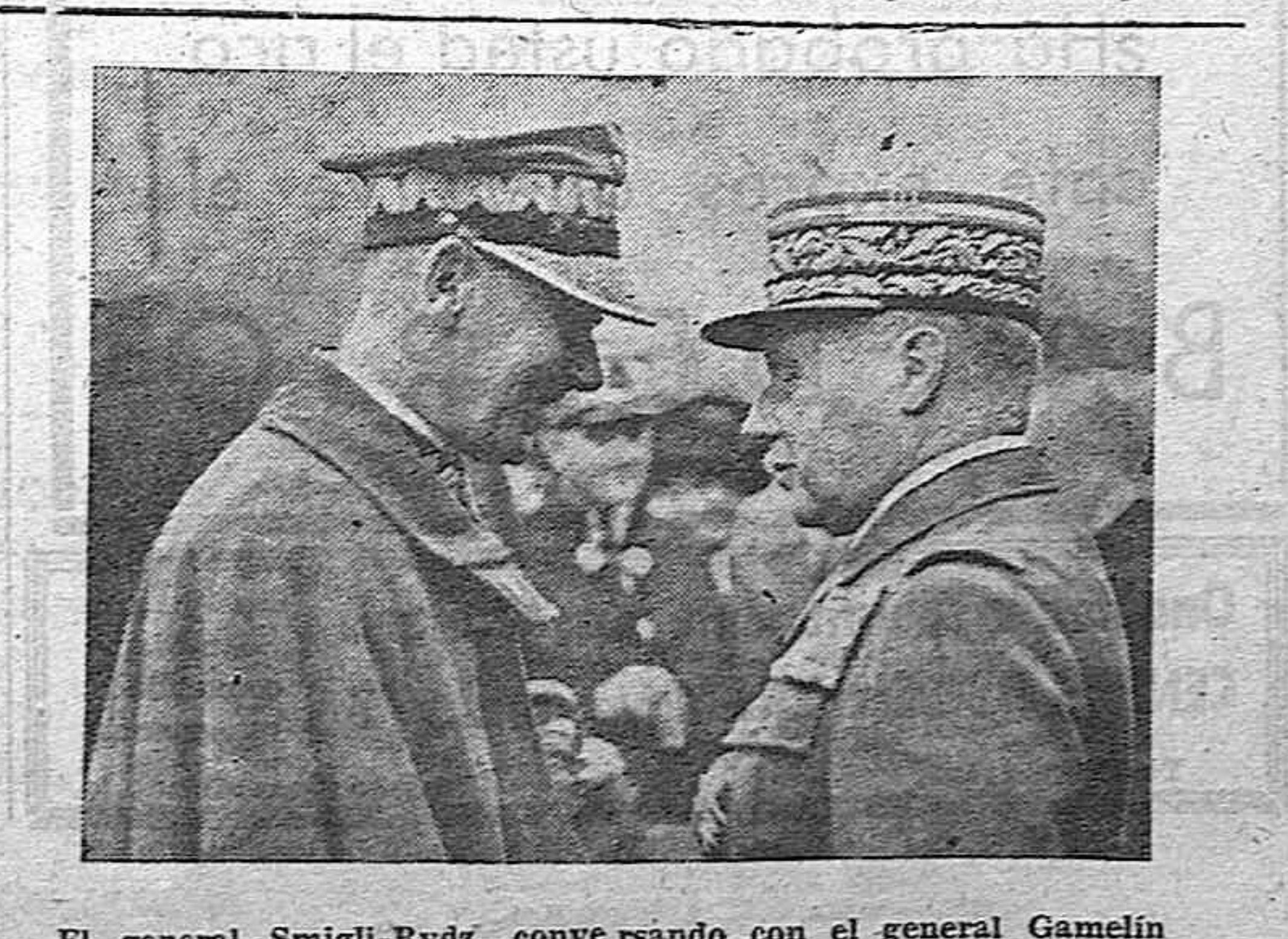
El general Smigli-Rydz, convesando con el general Gamelin

Llamamiento a los eslovacos. El Gobierno de Eslovaquia se dirige a sus súbditos residentes en el extranjero para que regresen al país. Berlín.—Comunican de Presbourg que el Gobierno eslovaco ha hecho una llamada a los eslovacos residentes en el extranjero, invitándoles a abandonar los Estados enemigos. El Gobierno eslovaco dice en la proclama que otras cosas, que sabe que se obliga a los súbditos eslovacos a combatir por la fuerza, por la llamada república checoslovaca. El pueblo eslovaco no permitirá jamás que el país caiga de nuevo en la esclavitud por intereses políticos de terceros. La actitud de las democracias obligando a los ciudadanos de la república eslovaca a entrar en una legión que enviarán a combatir contra sus hermanos, constituye una violación, no solamente del derecho internacional, sino también de los principios más elementales de la moral.—Stéfani.