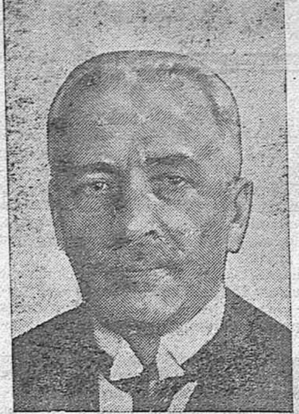
Mocicki, Presidente de Polonia

da cuenta de que ha sido evacuada la ciudad de