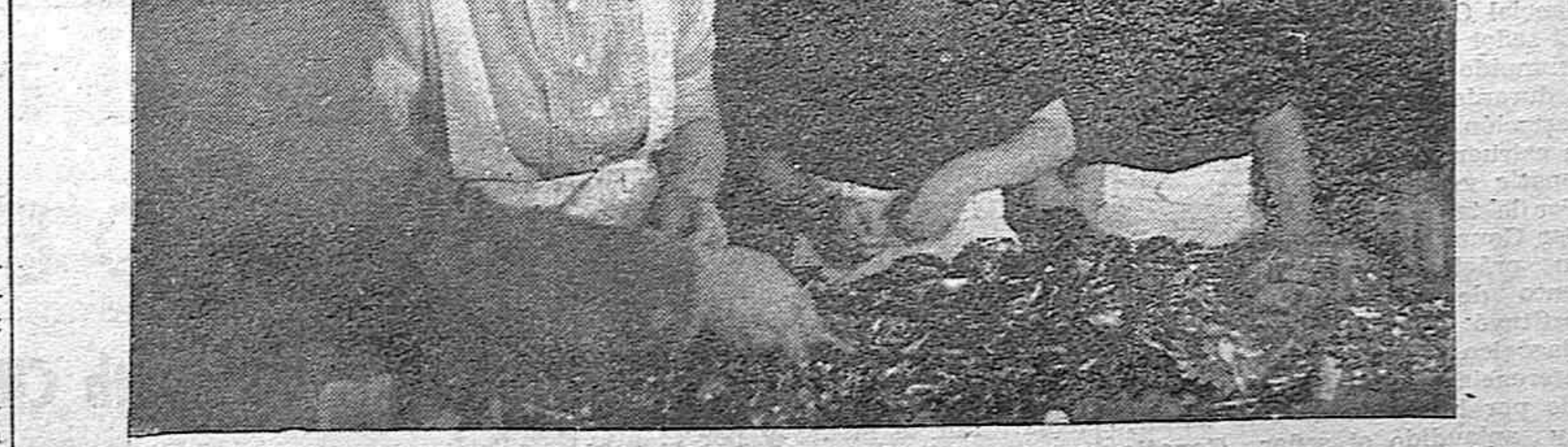
BURGOS.—Carmencita Franco Peio y los dos hijos mayores del ministro de la Gobernación, ante el montón de joyas que por un peso total de 50 kilogramos y un considerable valor, han entregado en el Laboratorio del oro para engrasar el tesoro nacional.

Catorce aviones alemanes derribados, según Varsovia Varsovia, 6 (3.30 t).—Una comunicación oficial polaca facilitada esta mañana anuncia lo siguiente: "Hemos derribado, catorce aviones enemigos. Seis aviones polacos no han regresado a sus bases. La guarnición polaca de Gdynia en atrevido ataque sobre las fuerzas de Dantzig, cogió doce prisioneros, un cañón y tres ametralladoras".