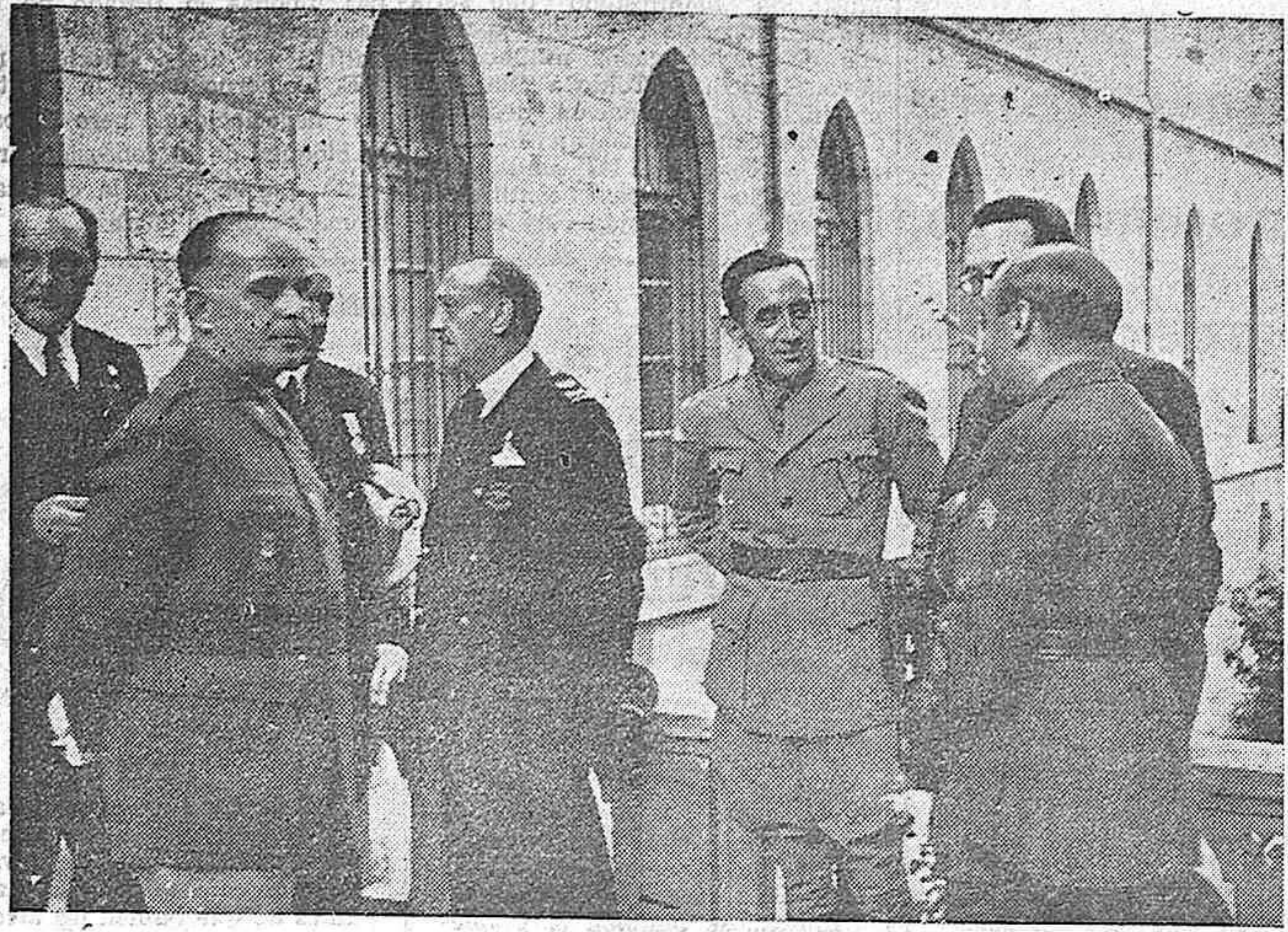
BURGOS.—De izquierda a derecha: Don Esteban Bilbao, ministro de Justicia; general Varela, ministro del Ejército; vicealmirante Moreno, ministro de Marina; don Alfonso Peña, ministro de Obras Públicas; general Muñoz Grande, ministro secretario del partido; señor Larraz, ministro de Hacienda, y teniente coronel Alarcón de la Lastra, ministro de Industria y Comercio, reunidos en la residencia del Caudillo poco antes de la primera reunión del nuevo Gobierno.

Burgos.—En la Dirección general de Prensa, orden del ministro de la Gobernación, se facilitó a los periodistas la siguiente referencia de lo tratado en el Consejo de Ministros celebrado en el día de hoy: