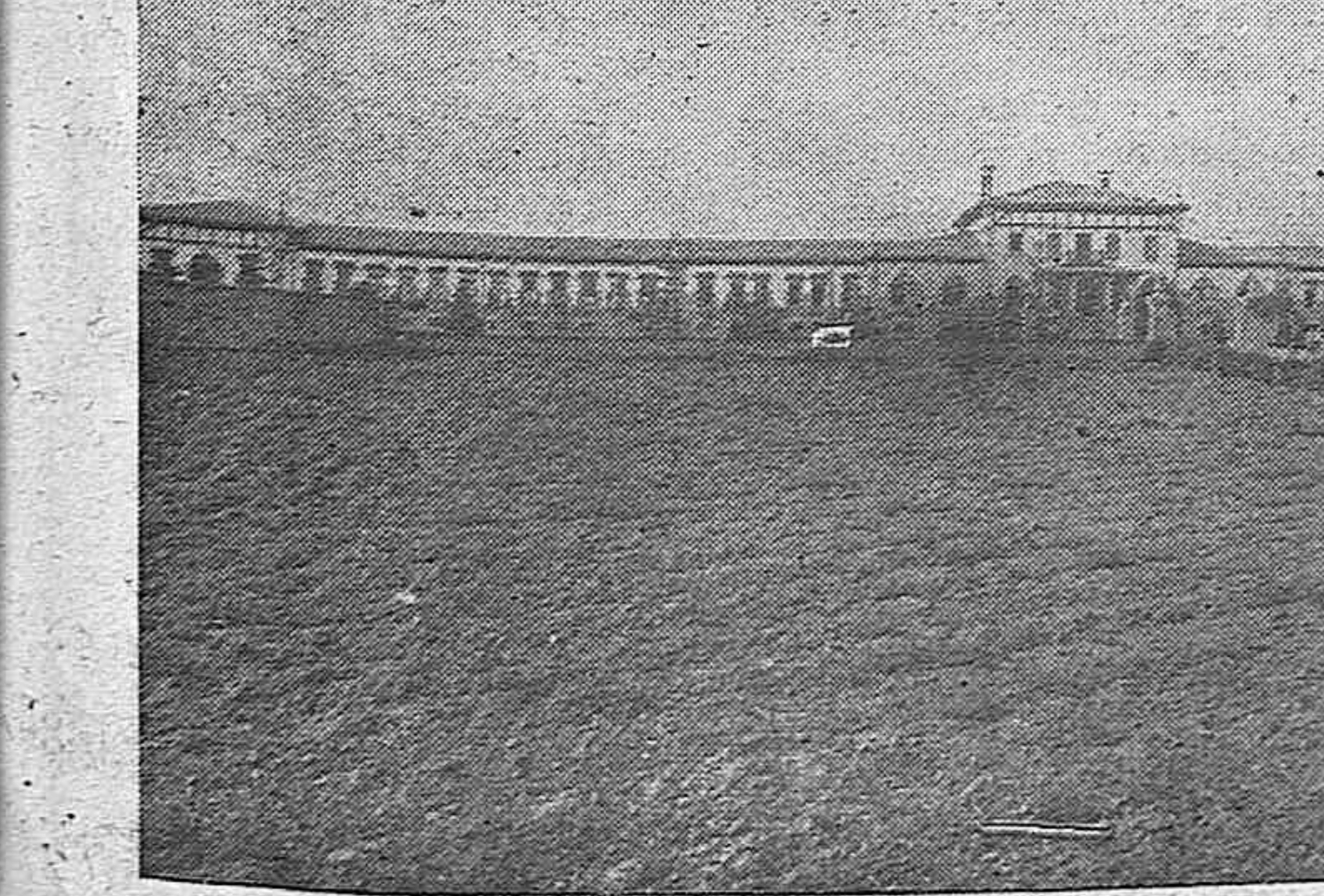
La atildada y novísima Enfermería de Nuestra Señora del Carmen (Pamplona), parece una cinta de salud engastada en el agro navarro con la traza sencilla y enérgica del corazón de sus paisanos.