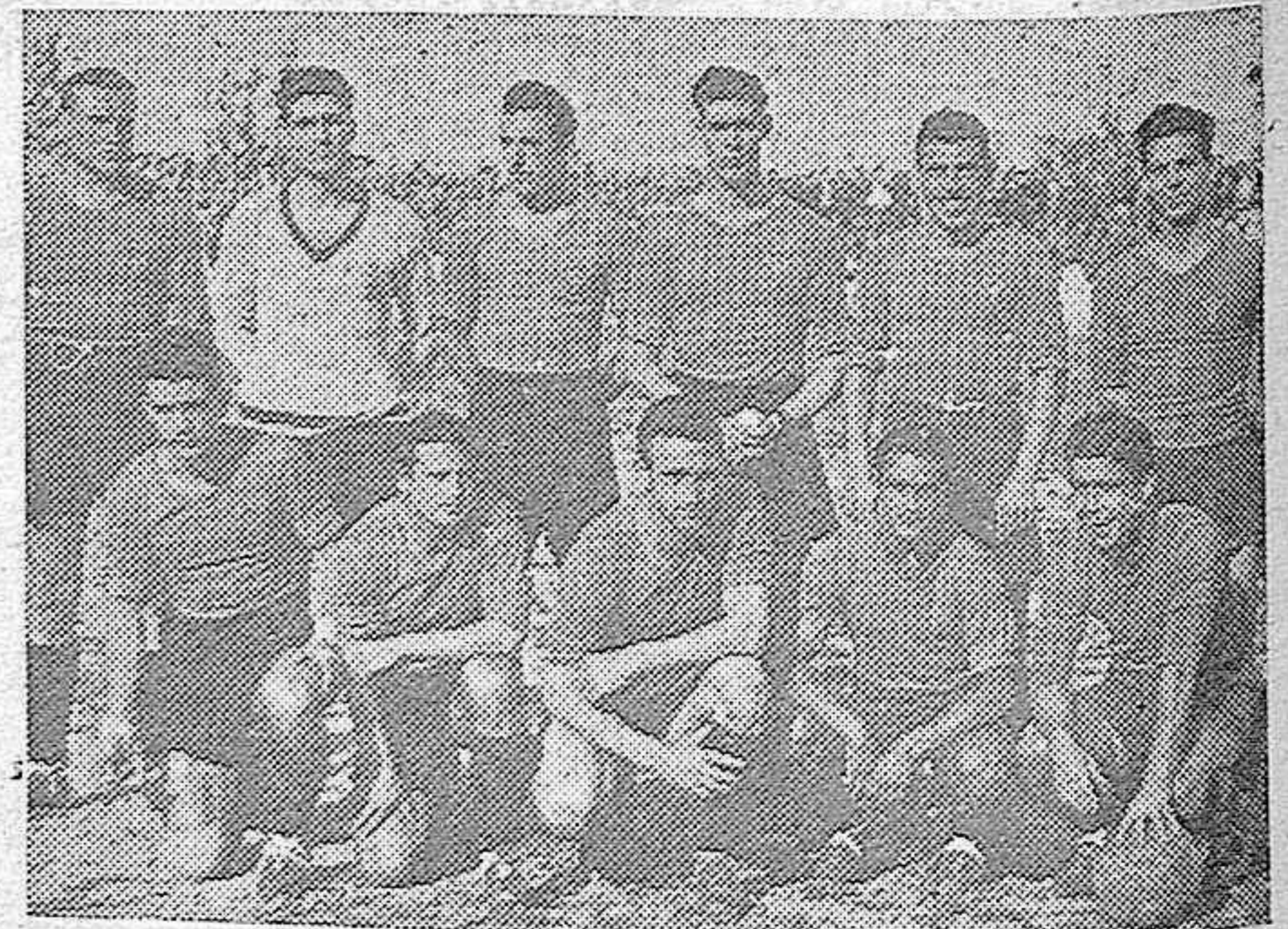
El equipo del Murcia, que con su brillante victoria de Cádiz ha terminado campeón de la Segunda División y asciende automáticamente a Primera, puesto por el que ha venido luchando en los últimos años.