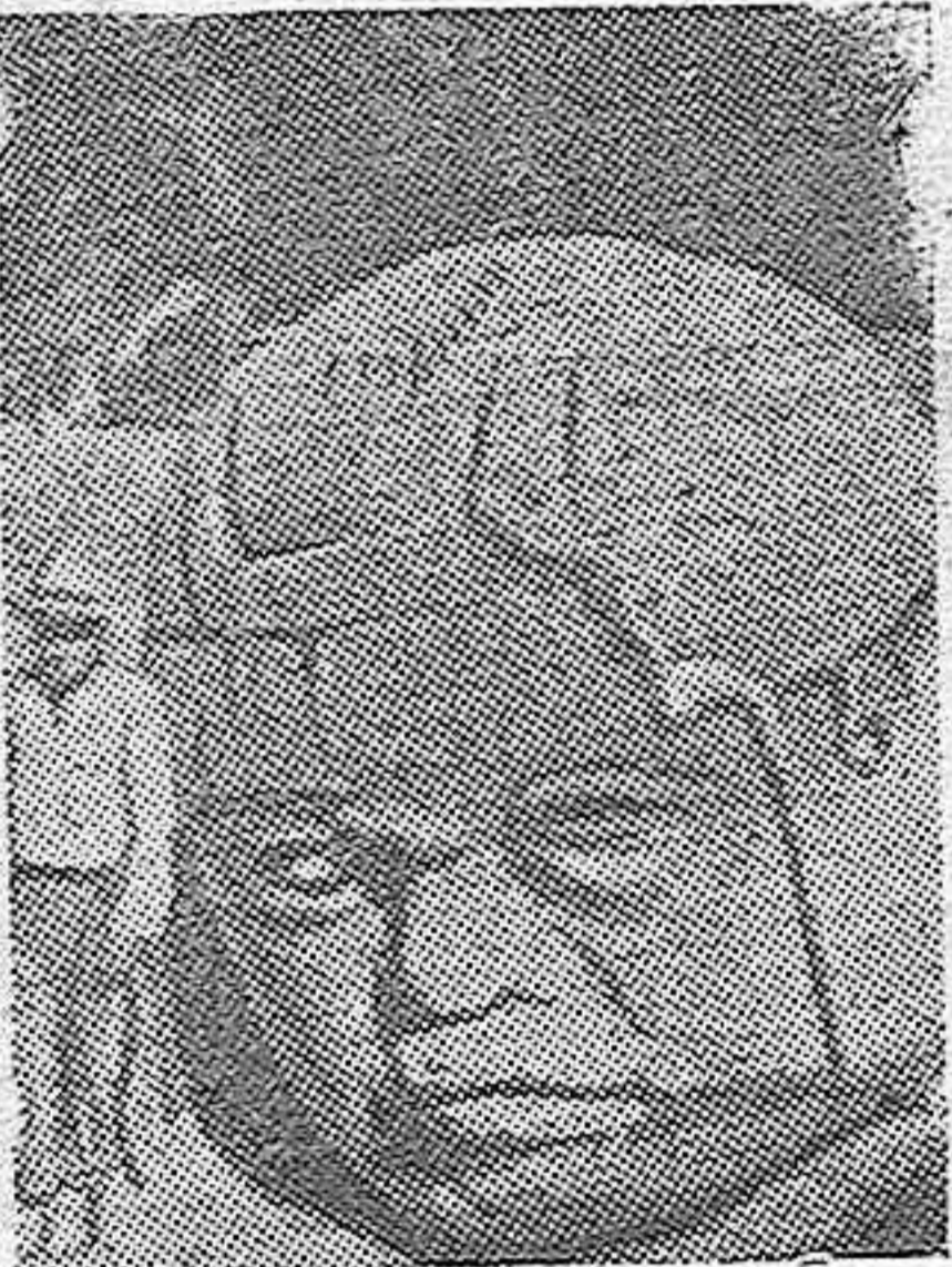
Varios arqueólogos norteamericanos han encontrado en una selva de Méjico cinco colosales cabezas de basalto, como la que aparece en nuestra fotografía.