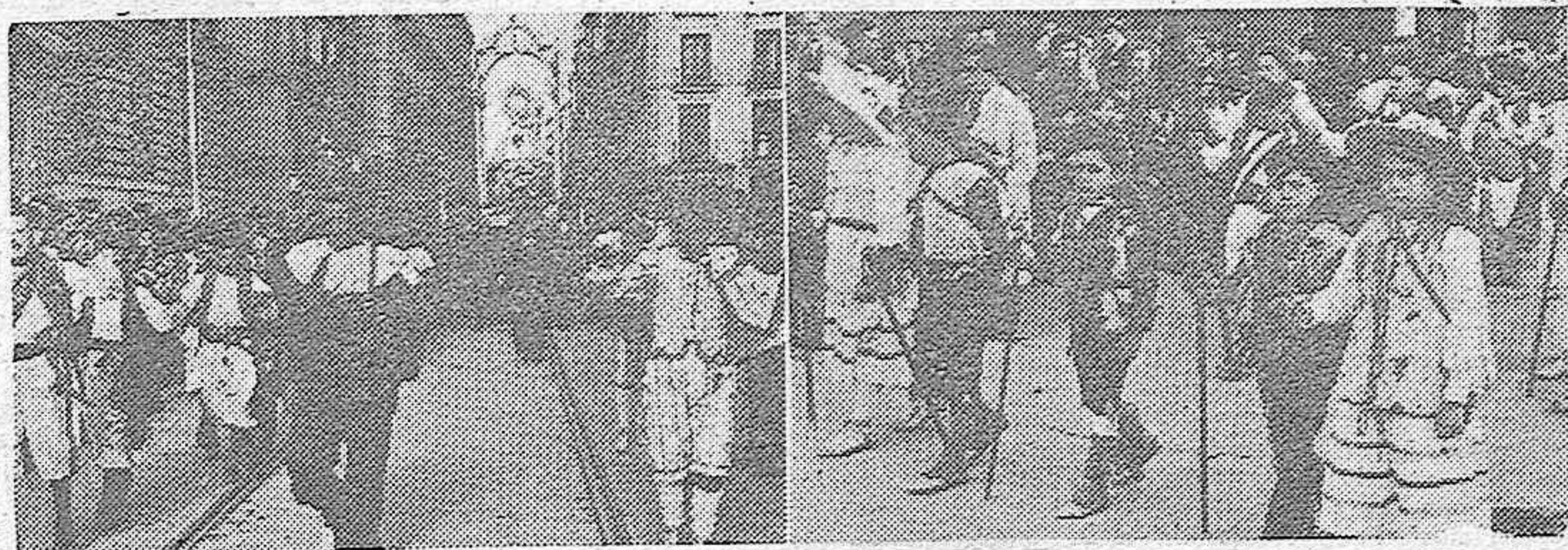
Por la calle Mayor de Madrid avanza la procesión de la Virgen de Valverde para conducir hasta el pueblo de Fuencarral—donde, según la tradición, se apareció Nuestra Señora a unos pastores— la nueva imagen recién construida para sustituir a la antigua, destrizada por los rojos. Delante del templo de la Virgen, los danzantes que intervienen en la tradicional loa compuesta en memoria de la aparición, ejecutan sus bailes de "moros y cristianos". A la derecha, un grupo de pastorcillos que figuran en la procesión, en memoria de aquel hecho milagroso.