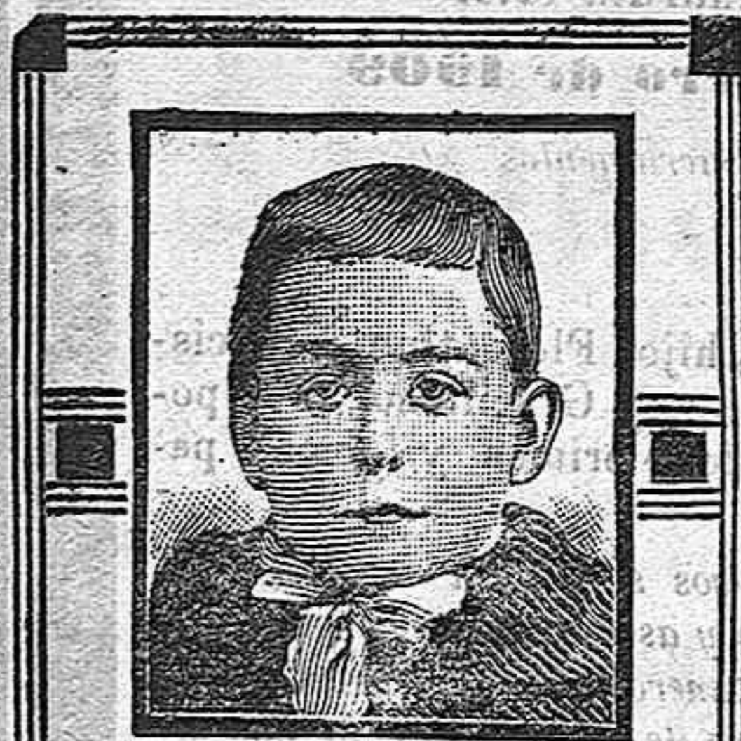
Mataró, 7 Marzo 1908.

A la hora en que este periódico llegue á manos de los suscriptores se está celebrando el segundo concierto con bastante más concurrencia que el de anteaer.