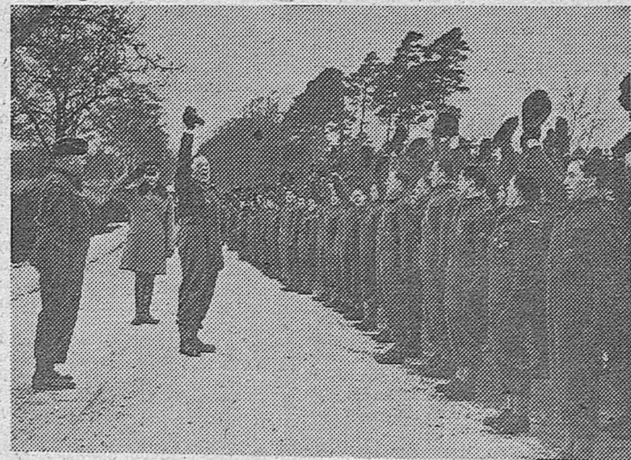
El Rey Jorge VI es aclamado por las tropas canadienses que se encuentran en Inglaterra, al pasarlas revista hace unos días.

Añade que, sin embargo, se desconoce todavía el verdadero objeto de la aparición de estas unidades en dichos parajes.—EFE.