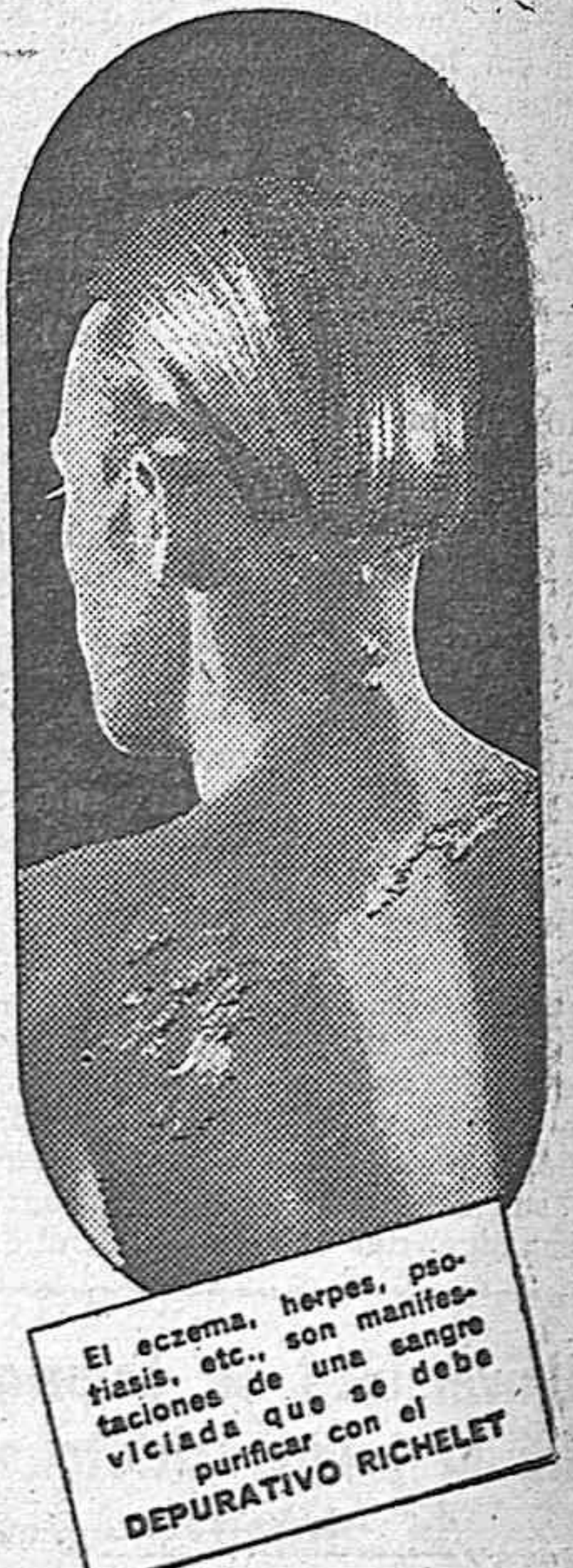
El eczema, herpes, psoriasis, etc., son manifestaciones de una sangre viciada que se debe purificar con el DEPURATIVO RICHELET

Enfermedades de la Piel y de la Sangre. Varices y llagas varicosas, Artritis, Arteriosclerosis, etc., combatidas con éxito creciente.