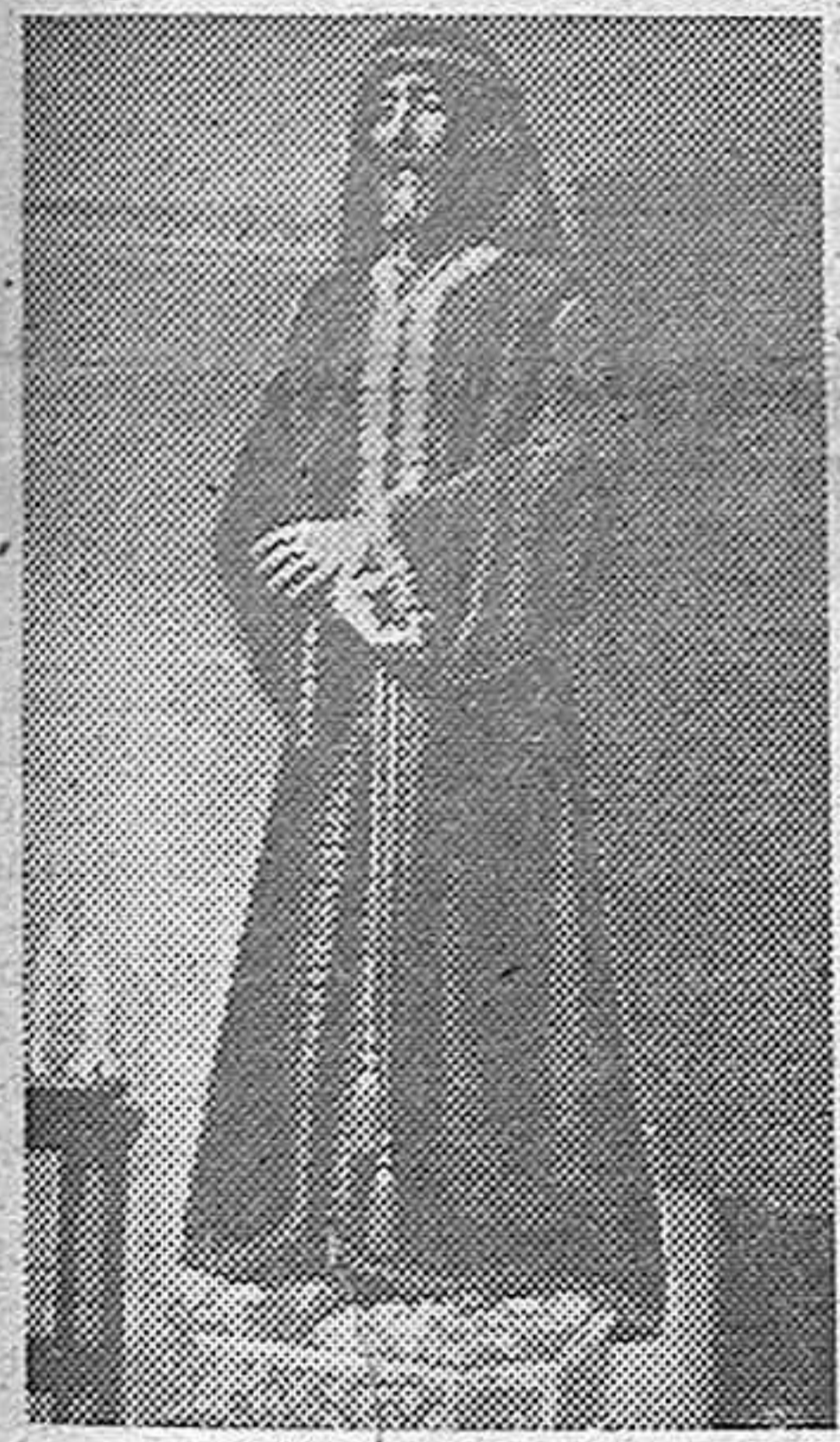
Esta imagen de Jesús Nazareno, obra del escultor Víctor de los Ríos, ha sido encargada a éste por los reclusos de Jaén, para que figure en las procesiones de Semana Santa de aquella capital andaluza.