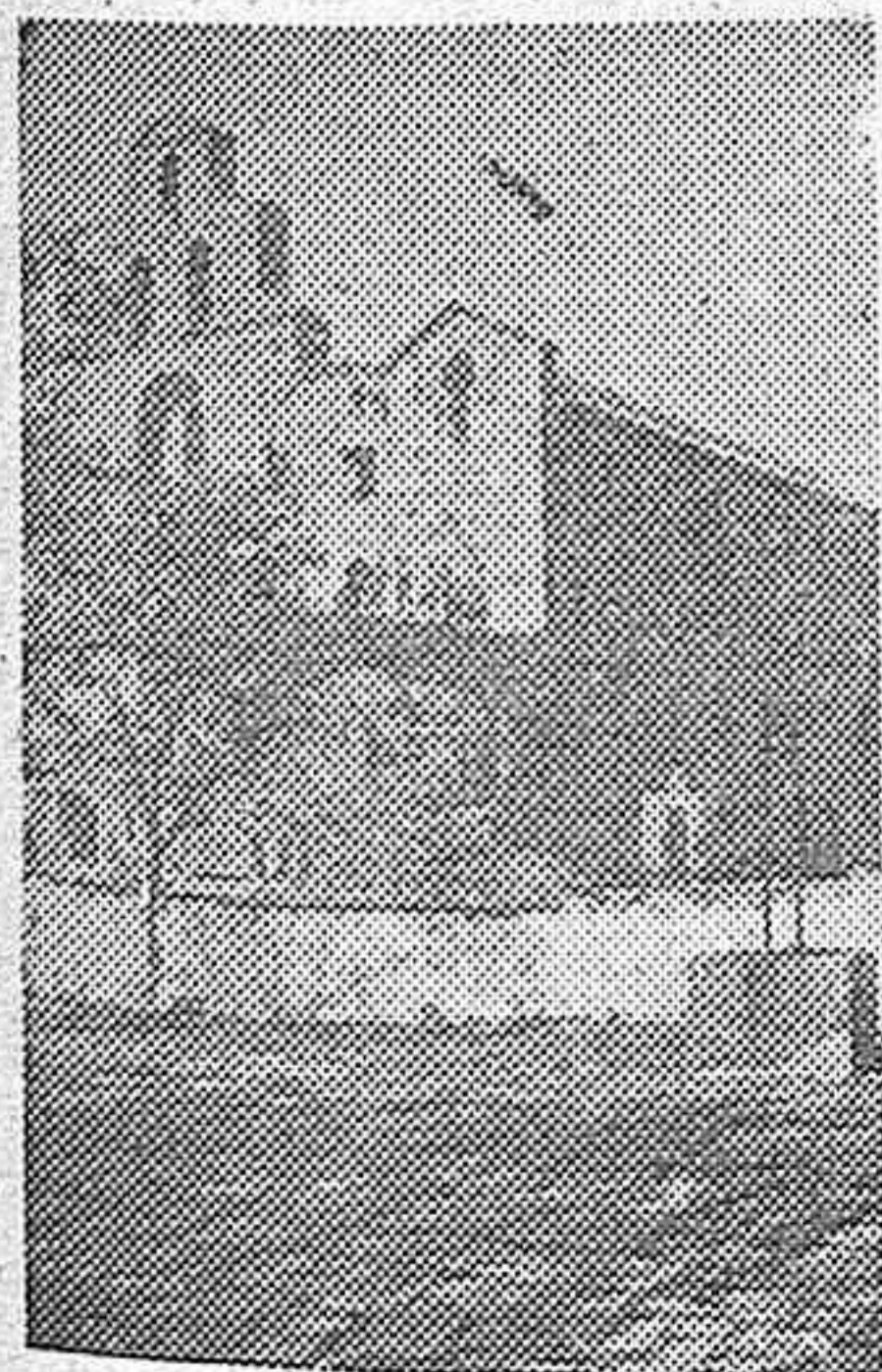
En breve comenzará la reconstrucción del Santuario de la Virgen de la Cabeza, enclavado en Sierra Morena, que los rojos profanaron y destruyeron. He aquí una vista de la antigua iglesia, que será fielmente reproducida.