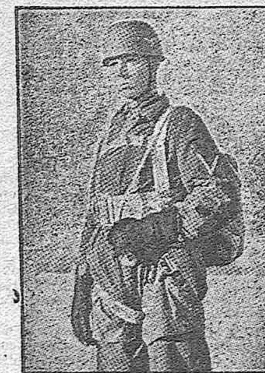
He aquí uno de los soldados alemanes perteneciente a la infantería aérea alemana, cuyos elementos son más bien conocidos con el nombre de «paracaidistas», y representa uno de los más positivos valores en las acciones relámpago del Ejército del Reich.