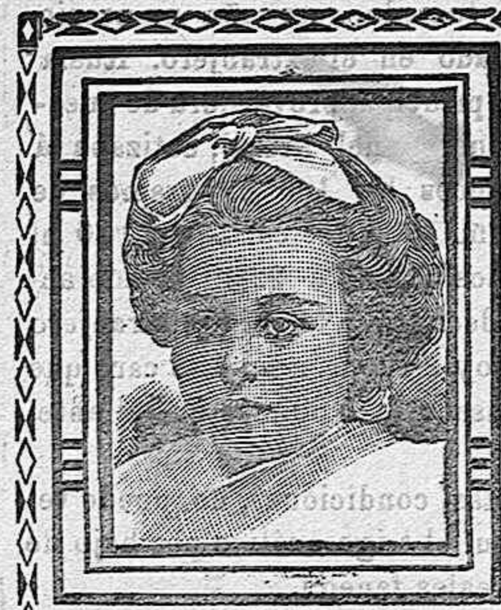
Barcelona, 11 Febrero 1908.

Nuestra breve noticia estaba claramente escrita y por esto no hemos de decir otra cosa que Ubi verbi non sunt ambigua non est locus interpretationi.