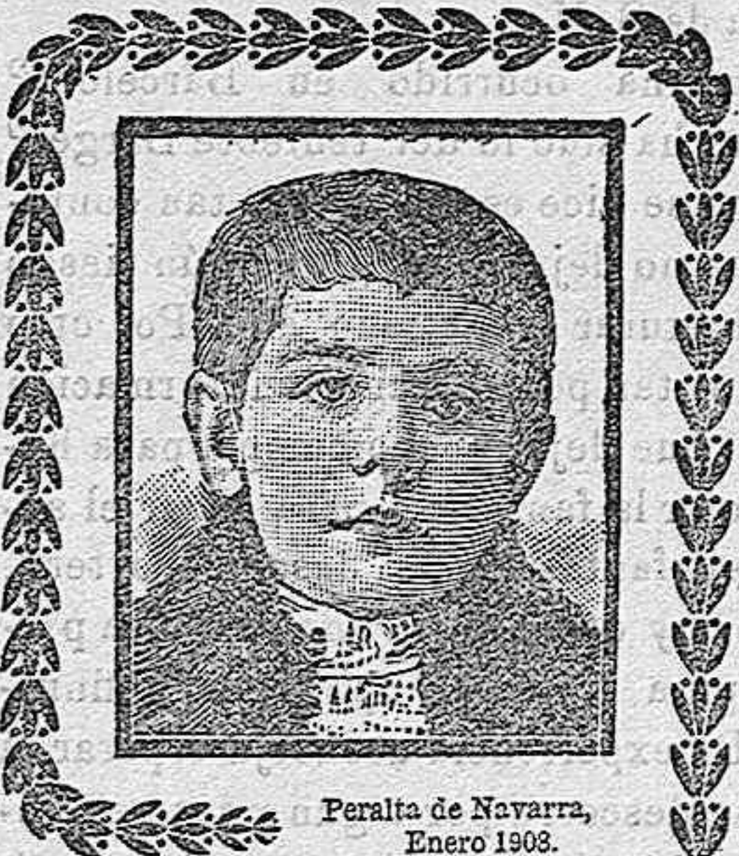
Peralta de Navarra, Enero 1908.

En esta quedan aprobados todos los dictámenes pendientes y se levanta la sesión.