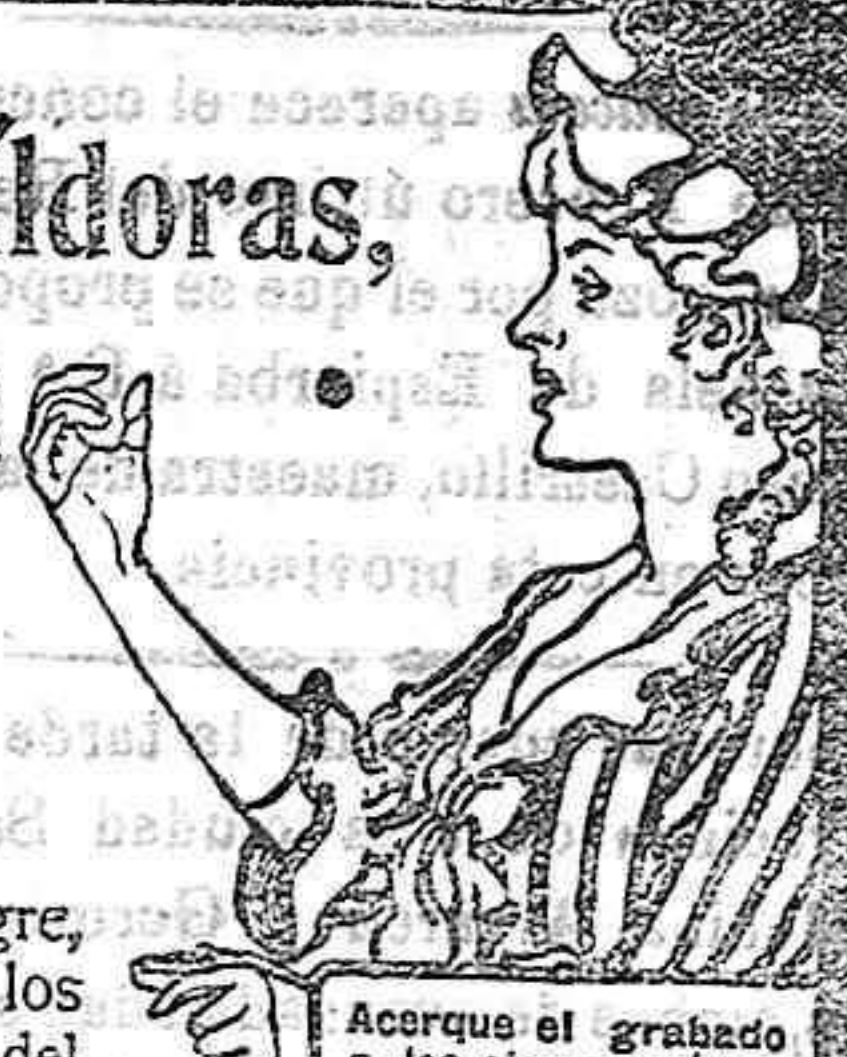
Acercue al grabado a los ojos y verá la píldora entrar en la boca.

DE VENTA EN LAS BOTICAS DEL MUNDO ENTERO.