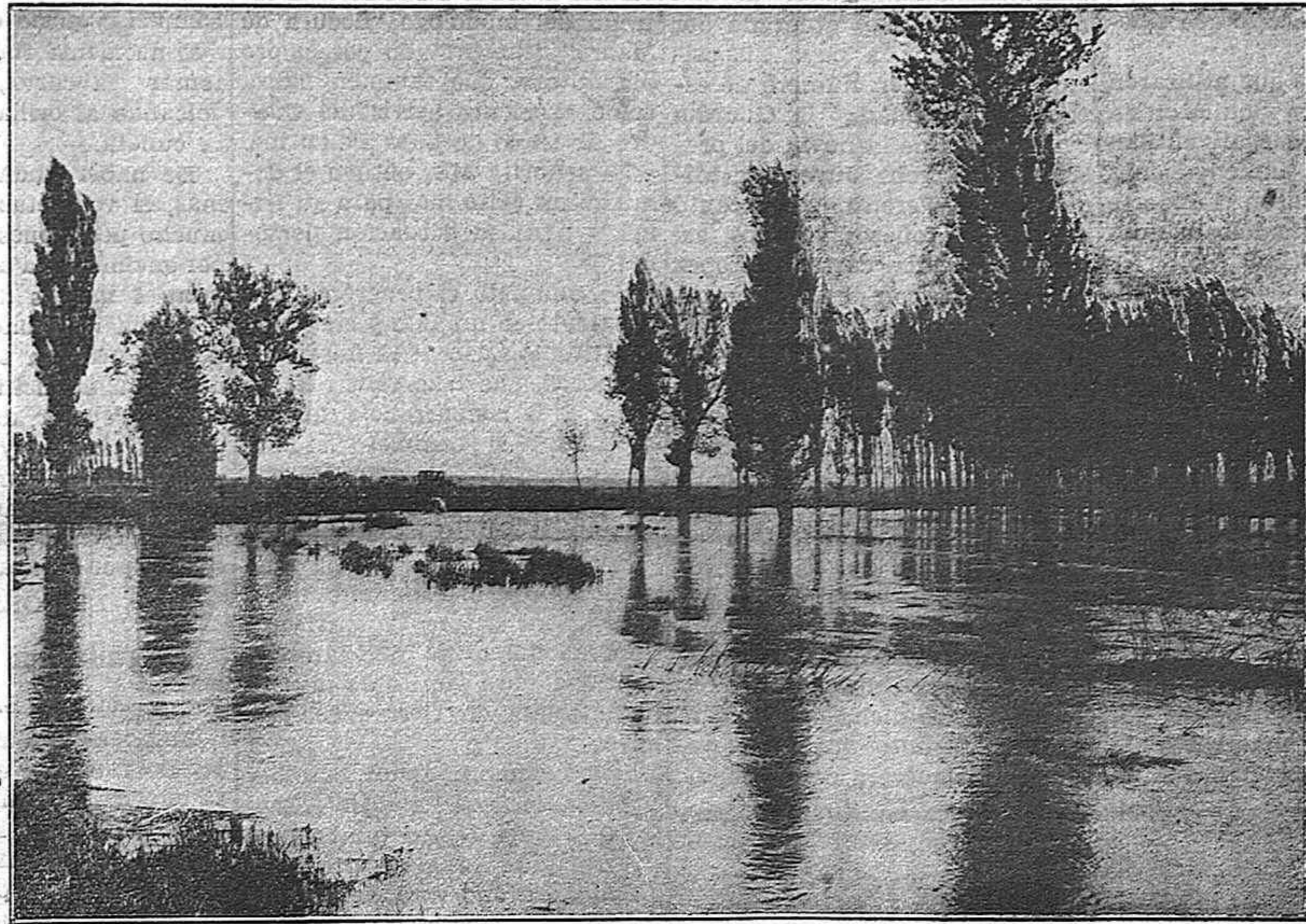
Una crecida del río Carrión en término de Villafolfo

Se ruega al que hubiere encontrado dos ruedas, entre Villalón a Palencia, las entregue en esta Administración, donde se le gratificará.