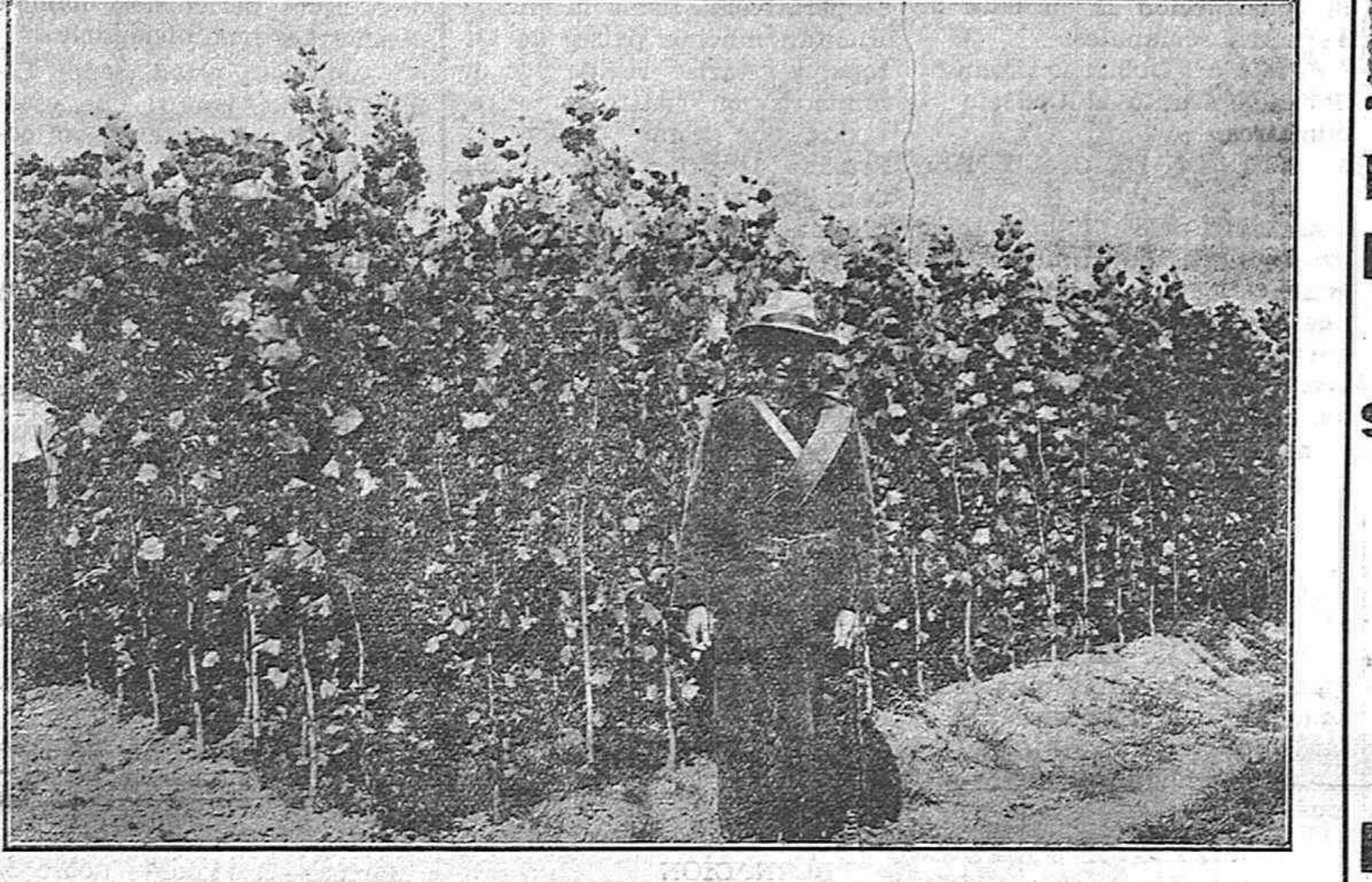
Chopo canadiense, de un año, en el vivero Carrión