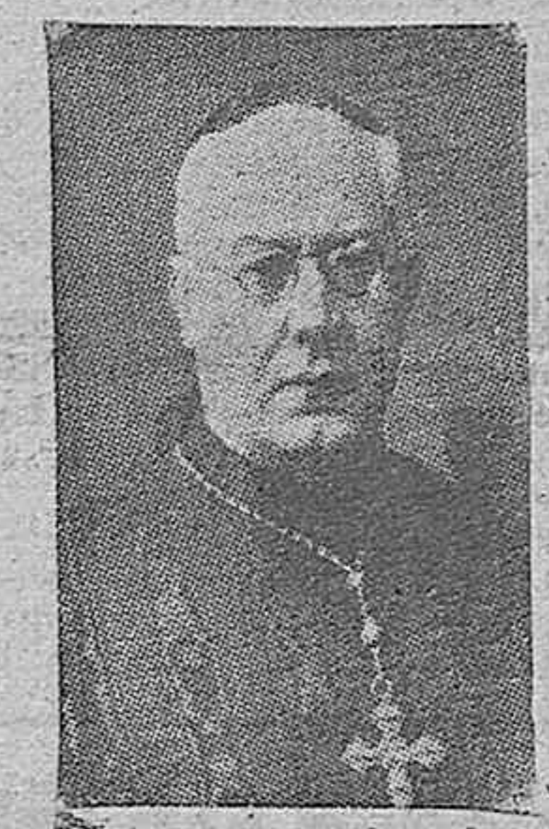
Su Santidad Pio XII, en el Primer Consistorio de su Pontificado, ha nombrado Camarlenjo al cardenal Lorenzo Lauri. El nuevo Camarlenjo nació en Roma en 1864, y en 1887 recibió los órdenes sacerdotales. Su carrera eclesiástica y diplomática ha sido brillante.

Washington, 15 (3.30 t).—Según informaciones recibidas por el Secretario de Estado el "Graaf Spee" ha obtenido permiso para permanecer en Montevideo 48 horas.—EFE