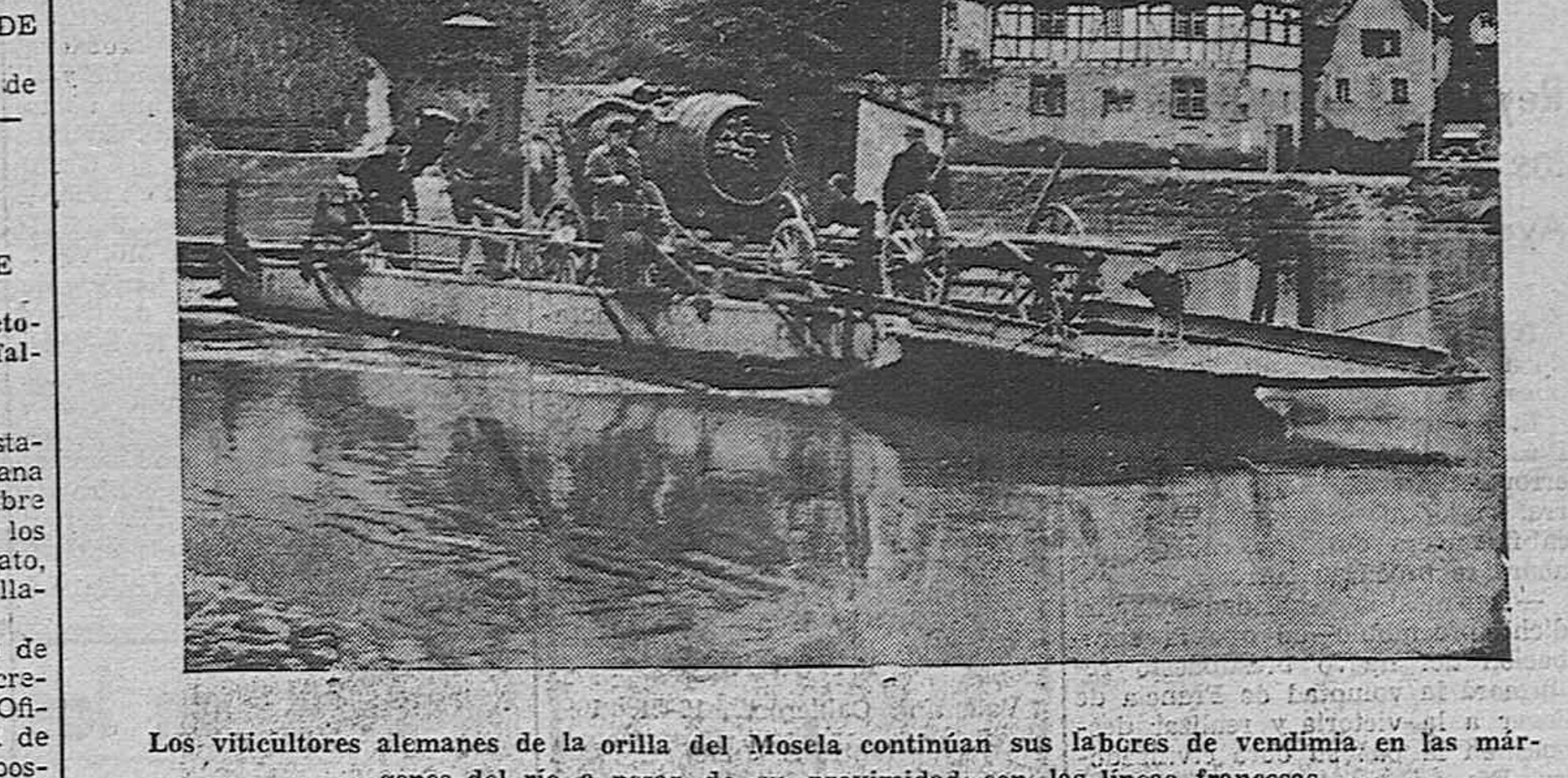
Los viticultores alemanes de la orilla del Mosela continúan sus labores de vendimia en las márgenes del río, a pesar de su proximidad con las líneas francesas.

Un avión alemán viola el territorio holandés Las patrullas holandesas, abrieron fuego, contesando el aparato La Haya, 20 (3,30 t).—Un avión alemán "Jaenkel" ha volado al N. O. de Holanda, a cien metros de las costas. Una patrulla holandesa abrió fuego contra el avión, el cual contestó a los disparos y desapareció en dirección Este. El Gobierno de Holanda ha protestado ante el Reich por la violación del territorio holandés y el fuego hecho por el aparato.—EFE.