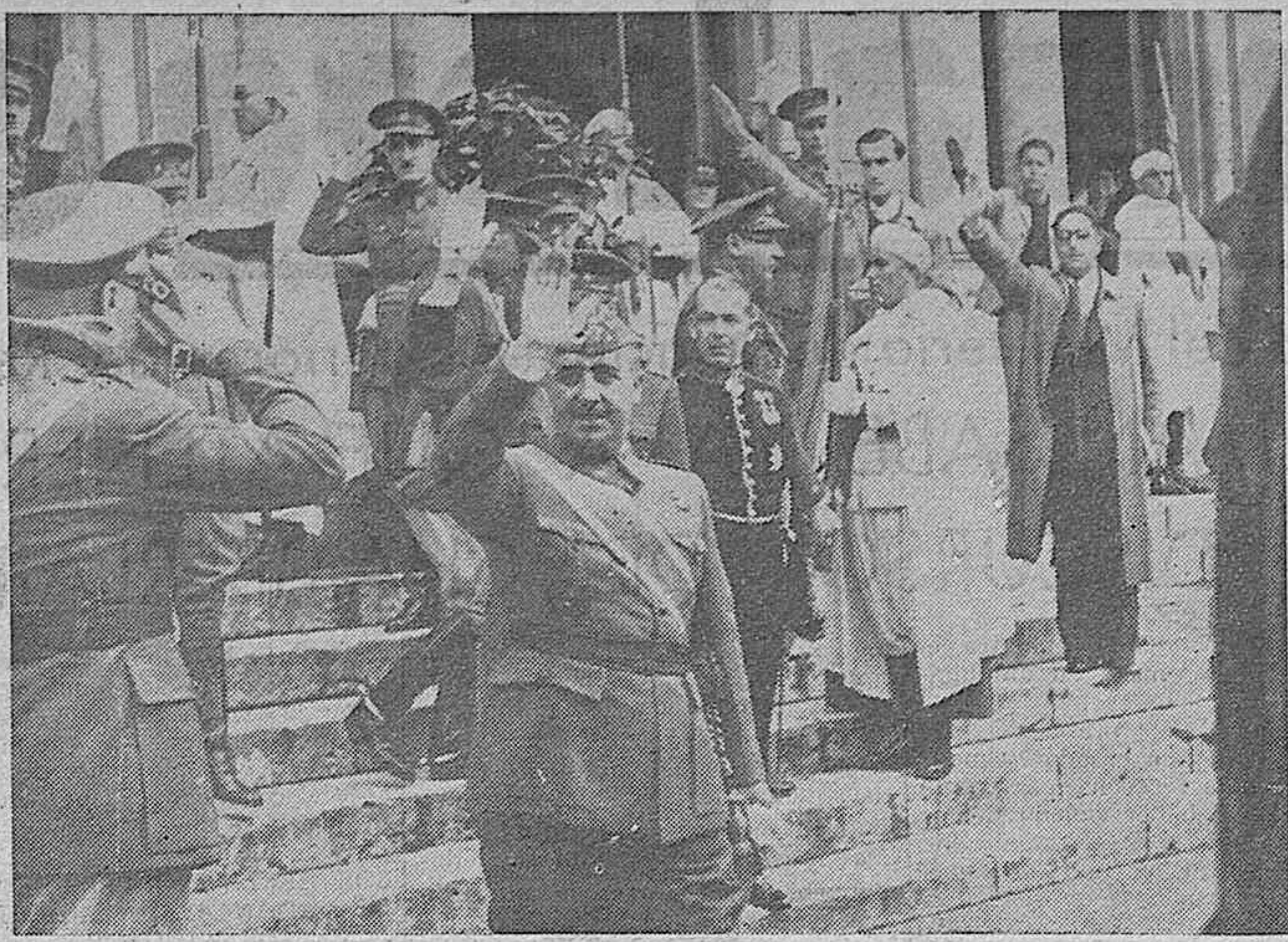
BURGOS.—El Caudillo al salir del Palacio de la División terminada la presentación de cartas credenciales del embajador de Italia.