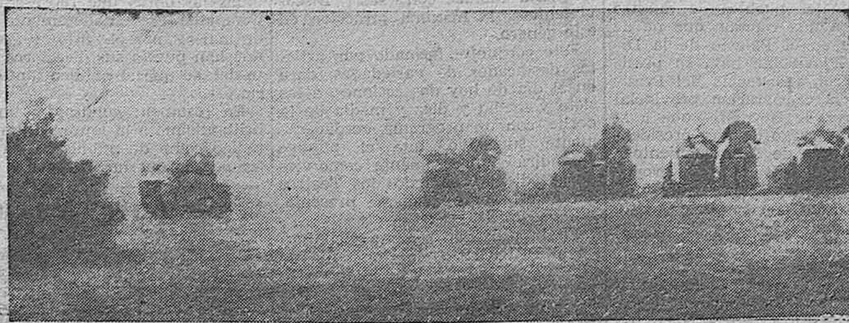
Columna motorizada francesa en acción

Es una unidad de Historia en la armada británica, habiendo tomado parte en la batalla de Jutlandia, durante la guerra de 1914-18. A su bordo se celebró un famoso Consejo de guerra motivado por una sublevación que hubo a bordo, cuando el navío se encontraba en alta mar. También sufrió el fuego de la escuadra española durante la guerra en este país. El coste de dicho barco había sido de dos millones y medio de libras esterlinas.