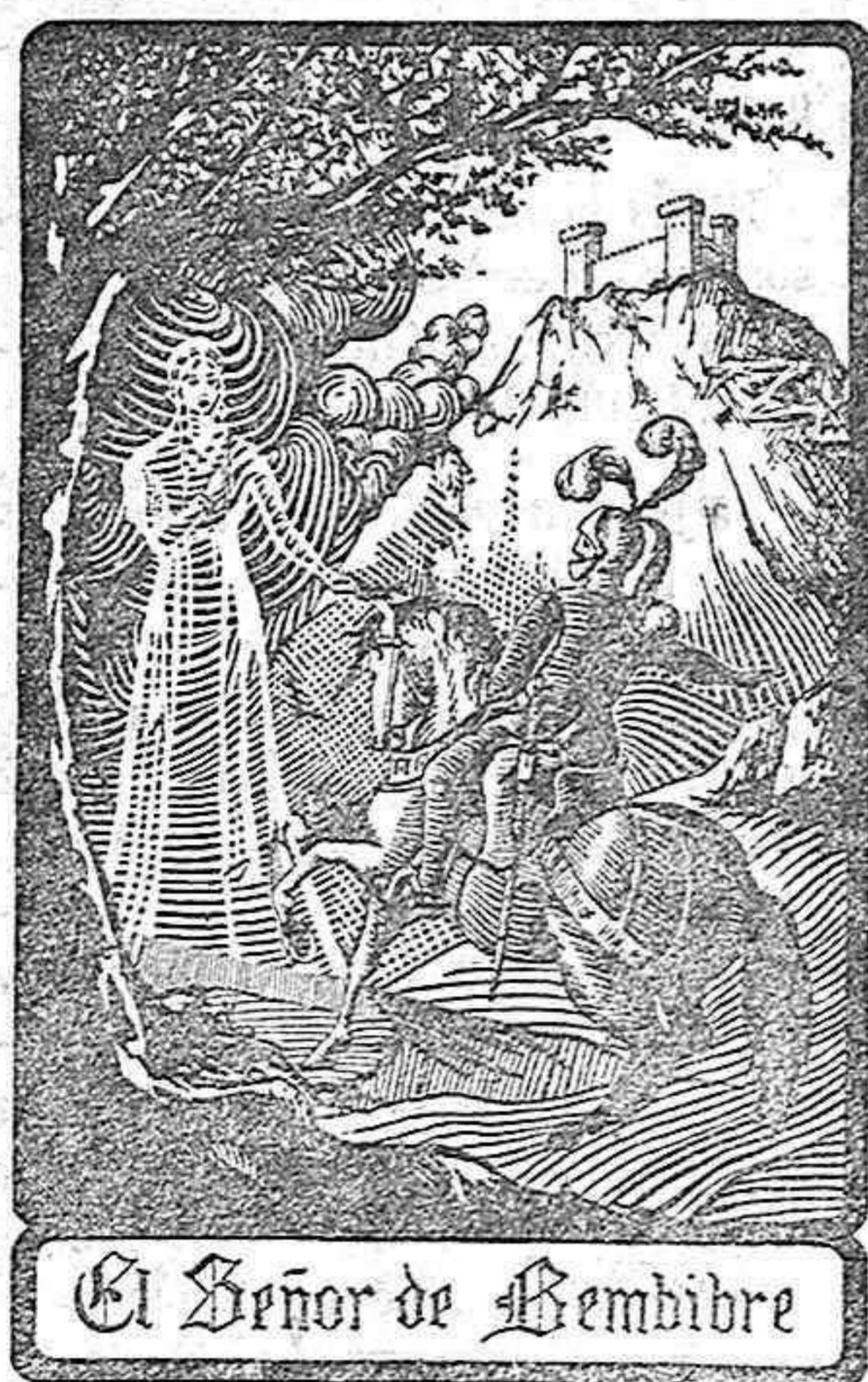
El Señor de Bembibre