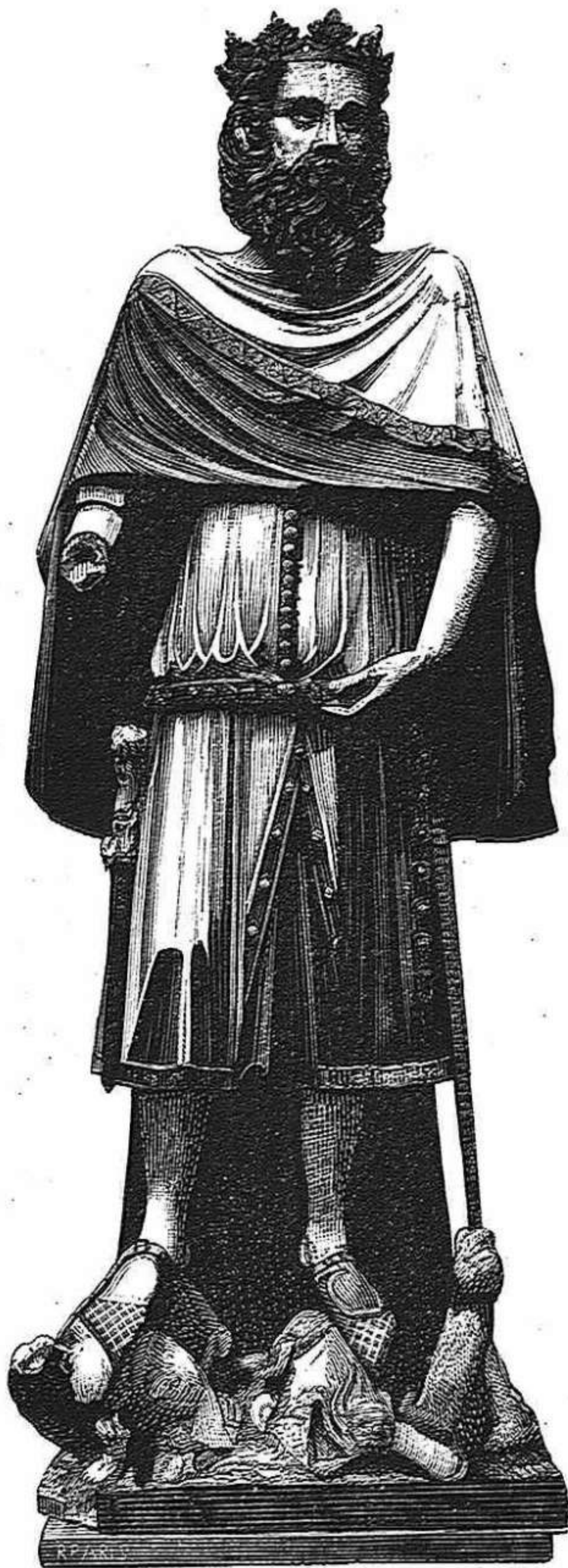
ESTATUA DE CARLOMAGNO EN LA CATEDRAL DE GERONA.

ricos más aún que los pobres, los sabios con mayor ahinco que los ignorantes, trabajan asociados uno y otro día en cosas y tareas que parecen de poca monta, pero que constituyen una de las principales causas del rápido progreso de la Gran Bretaña. Aquí queremos alcanzar las cosas de una sola vez, con leyes primorosas y si costumbres previas, dejándolo todo al Gobierno, sea cualquiera el partido á que pertenezca, y criticándole acerbamente.