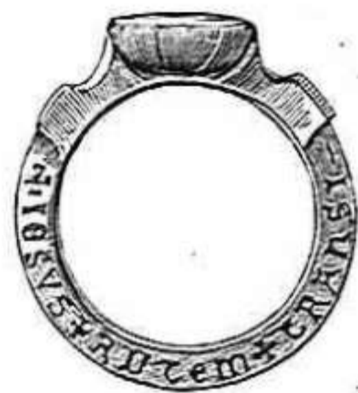
NÚM. 1. — DESCUBIERTO EN CAMPRDON.