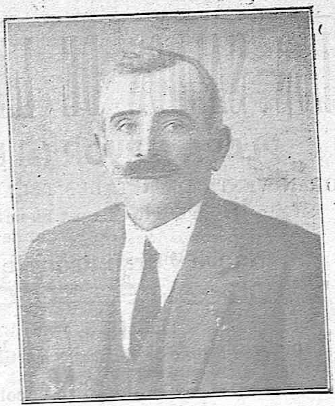
Don gu tin Frías Conservador (Sepúlveda)