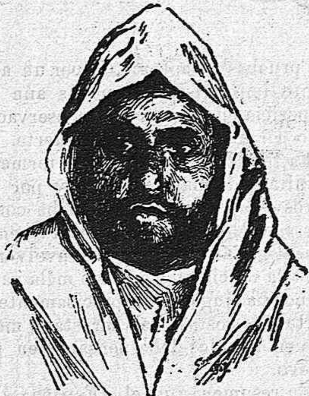
Muley Hafid, cuya abdicación es hoy la nota más importante en el mundo político.