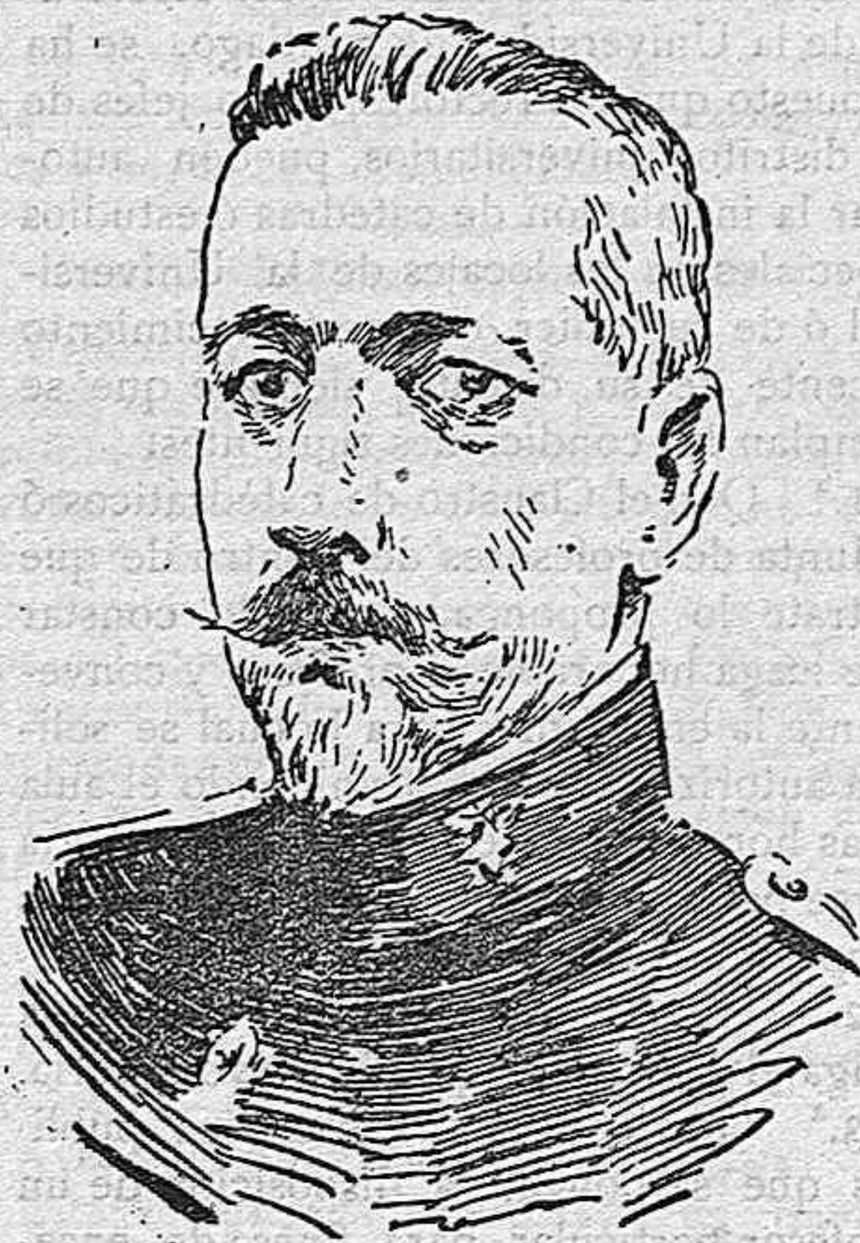
GENERAL D. JUAN ZUBIA que ha sustituido interinamente al general Aguilera en el Ejército de Melilla.