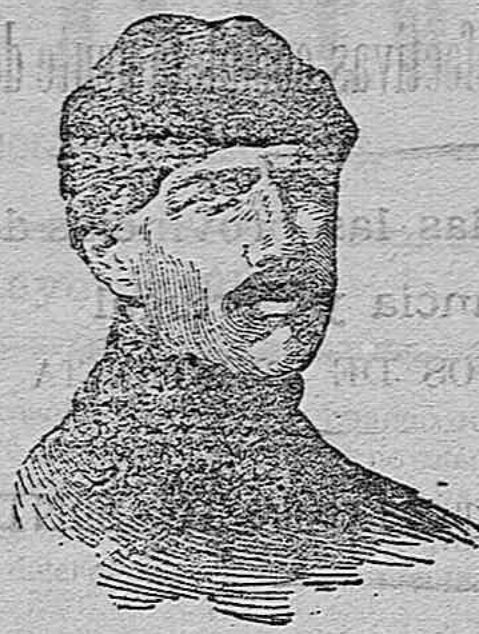
D. Alfredo Kindelán

Una vez en la Corte, subió por las calles de Alcalá, Puerta del Sol y Calle Mayor hasta dar vista al regio alcázar presenciando la real familia desde los balcones las diversas evoluciones que