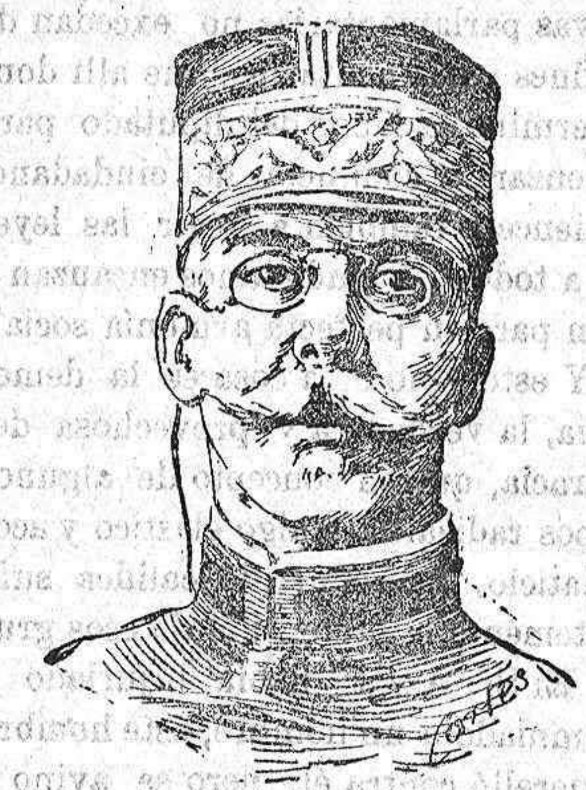
El general Moinier Jefe de las tropas francesas que defienden a Fez

Y para terminar si a La Crónica le consta cuanto dice sobre este particular, permítanos le digamos que no cumple con su deber, pues creemos que este le imponía, en defensa de los intereses de esta región, hacer públicos los nombres de los que queriendo ser ó representar algo en la provincia, sólo porque sí, por resquemores políticos ó por bajas pasiones estorban la realización de proyectos que habrían de redundar en provecho de esta tierra abandonada de sus Diputados, aunque se llamen Brocas ó Romanones.