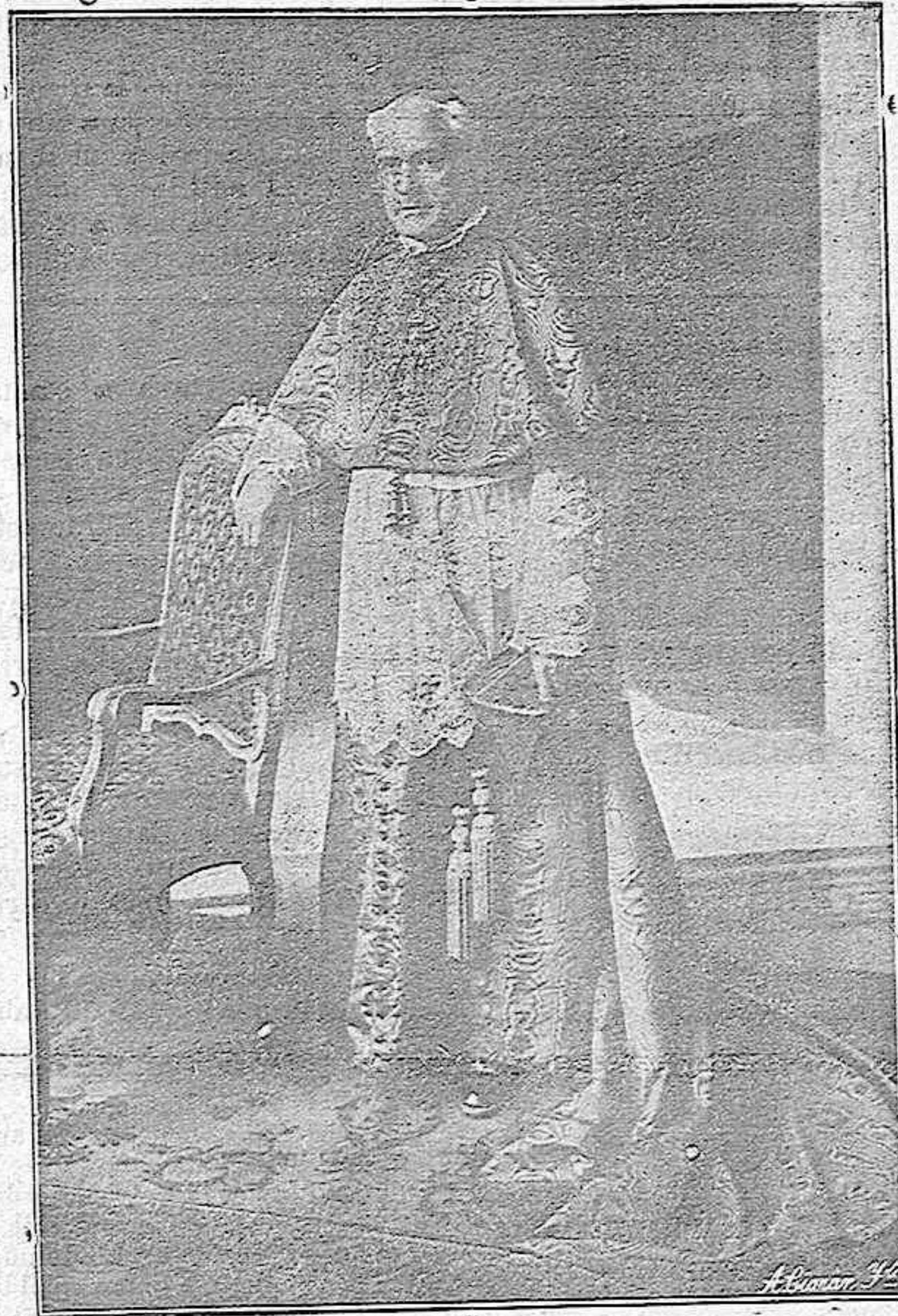
Emmo. y Rvdo. Sr. D. Enrique Reig Cardenal Prímado de España, que ha presidido la Asamblea Encarística de Guadalajara.

-X- Grandioso recibimiento a nuestro Prelado, iniciador de la Asamblea, que ha sido aclamado con entusiasmo durante tres días -X-